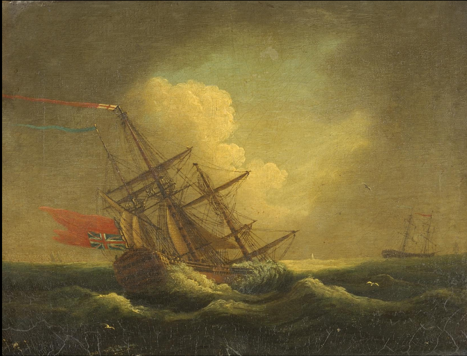
Peter Monamy, Πλοίο σε καταιγίδα, λάδι σε καμβά, Συλλογή Ιδρύματος Αικατερίνης Λασκαρίδη