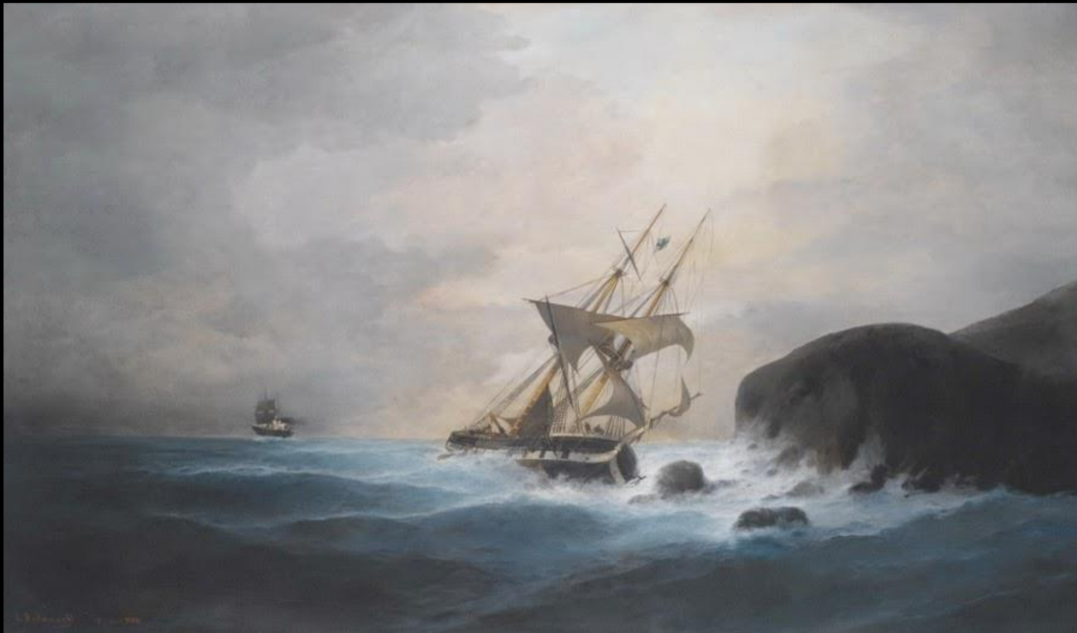
Κωνσταντίνος Βολανάκης, Κατά μήκος της Ακτής του Πειραιά, π. 1902, λάδι σε καμβά, Ιδιωτική Συλλογή