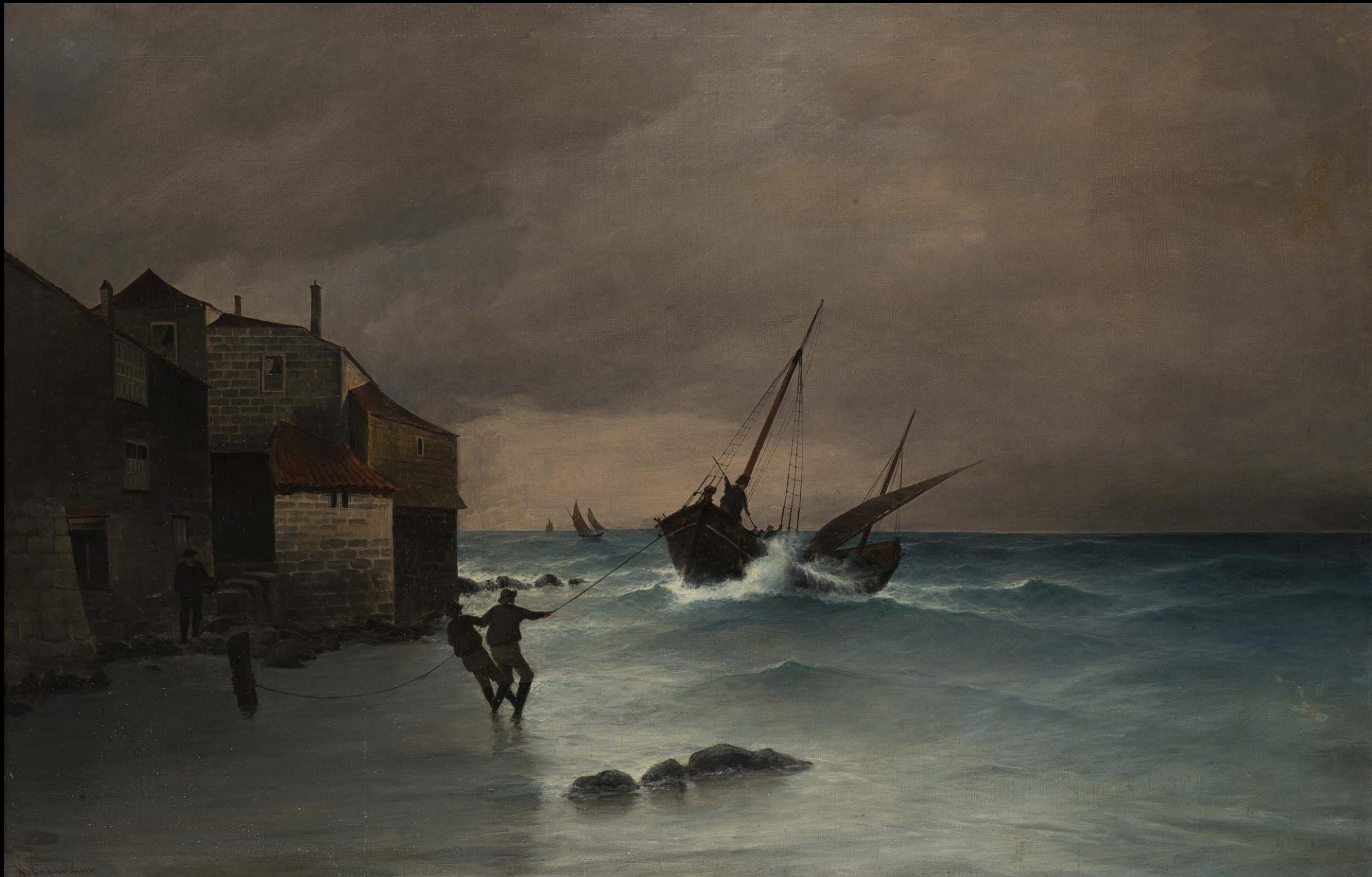
Κωνσταντίνος Βολανάκης, Η Παλίρροια, 1900 – 1902, λάδι σε καμβά, 67x101 εκ., Συλλογή Ιδρύματος Αικατερίνης Λασκαρίδη