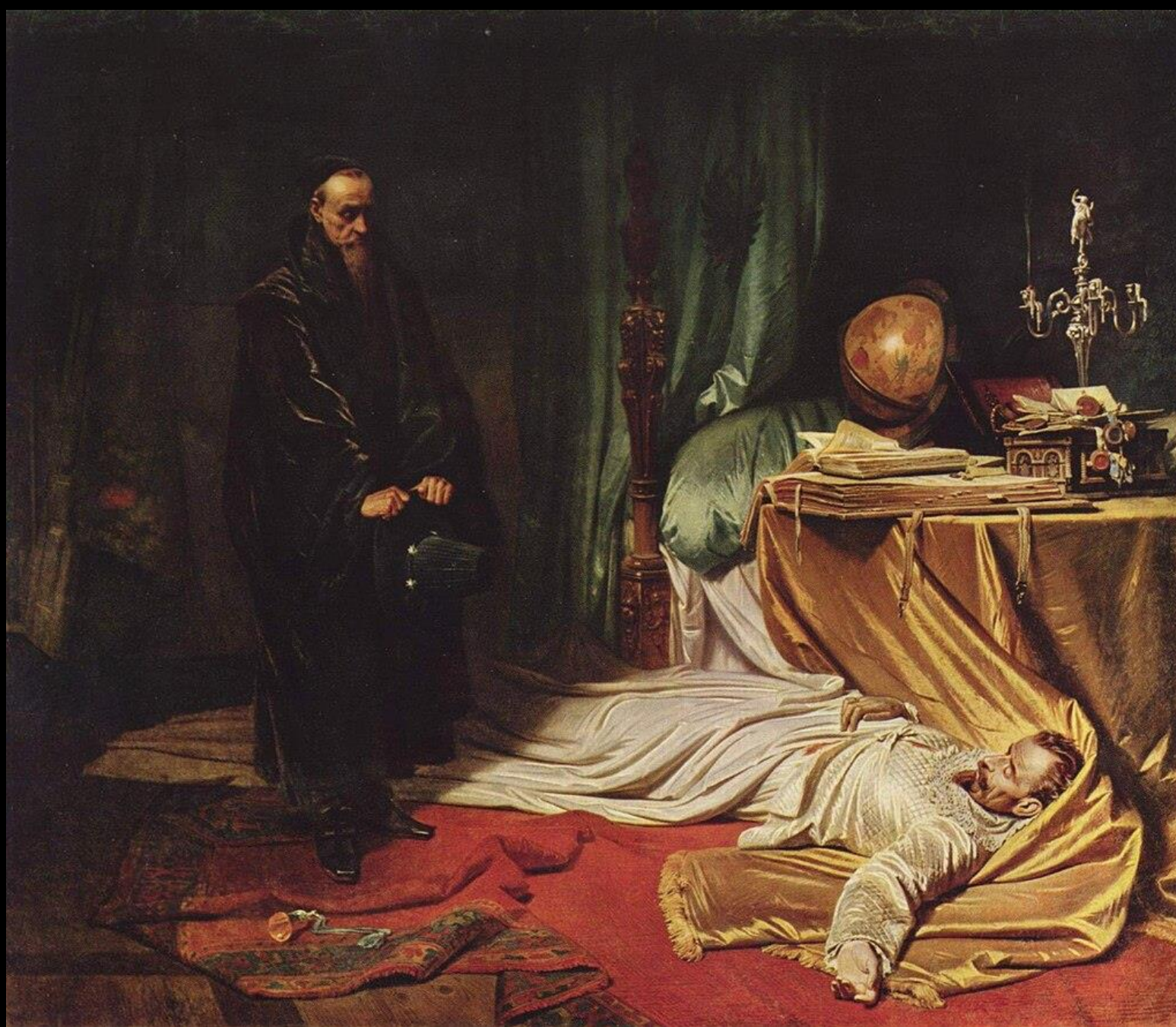
Karl von Piloty, Ο Seni μπροστά στο πτώμα του Wallenstein, 1855, λάδι σε καμβά, 312x365 εκ., Neue Pinakothek, Μόναχο