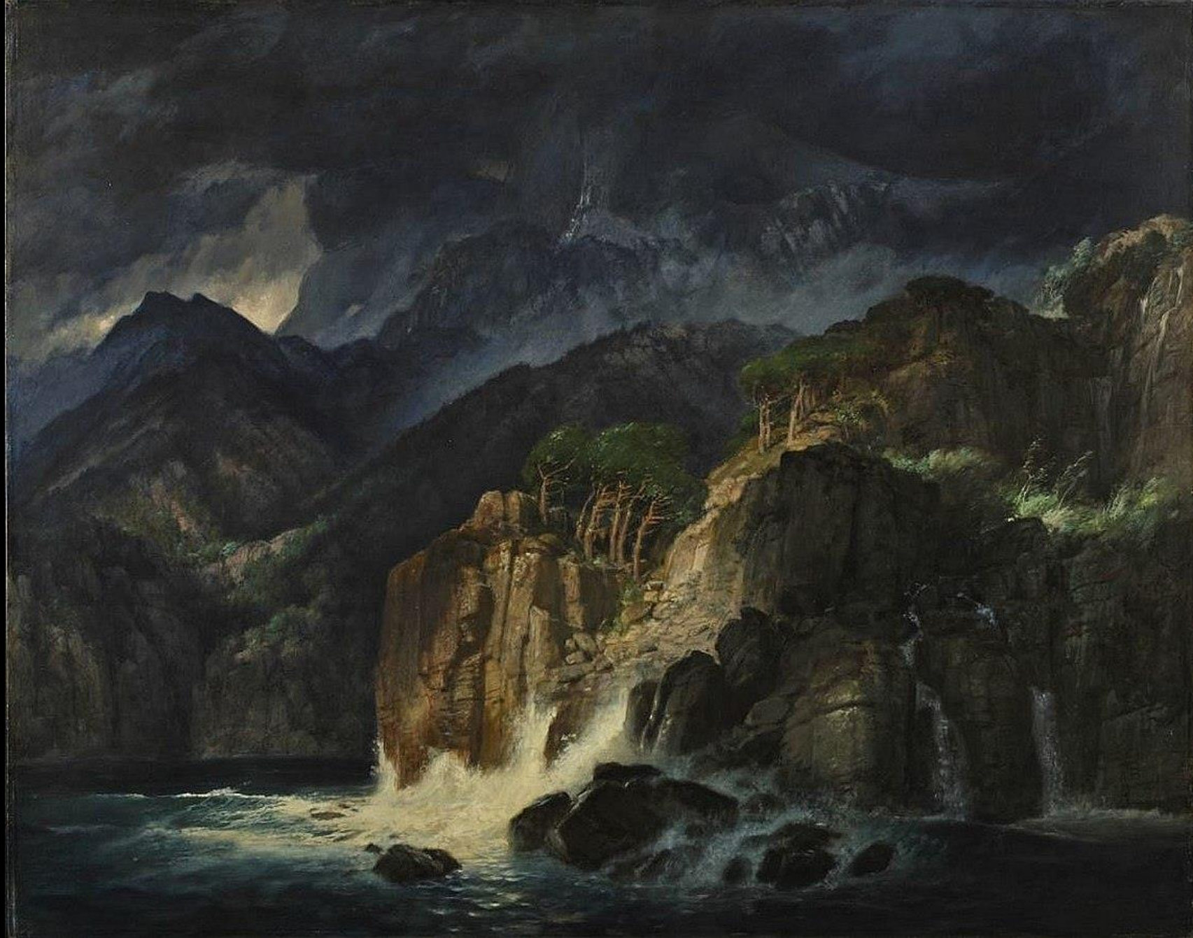
Arnold Böcklin, ο Δεμένος Προμηθέας, 1885, λάδι σε καμβά, Hessisches Landesmuseum, Darmstadt