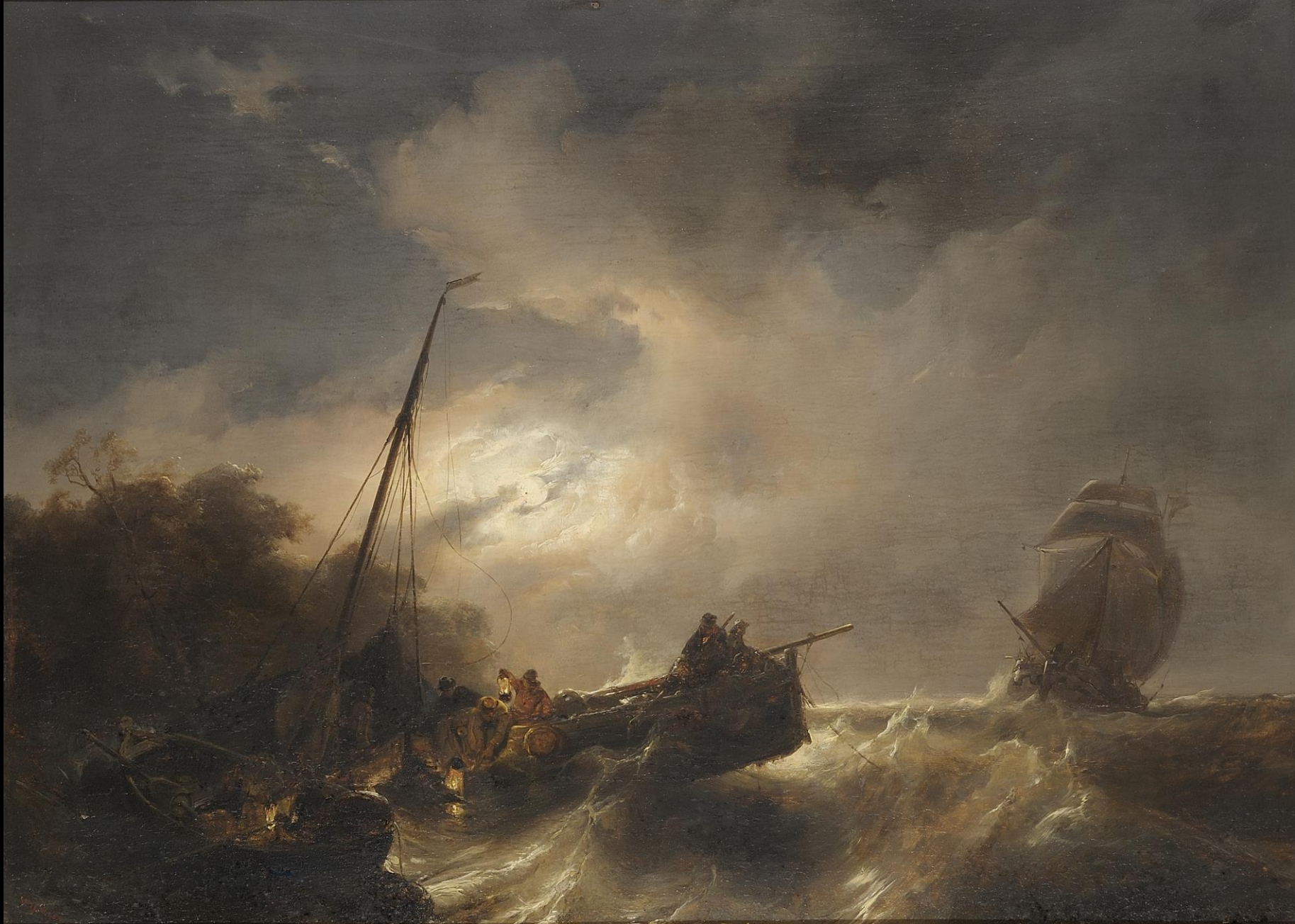
Wis Noyen, Η διάσωση των ναυαγών, λάδι σε καμβά, Συλλογή Ιδρύματος Αικατερίνης Λασκαρίδη