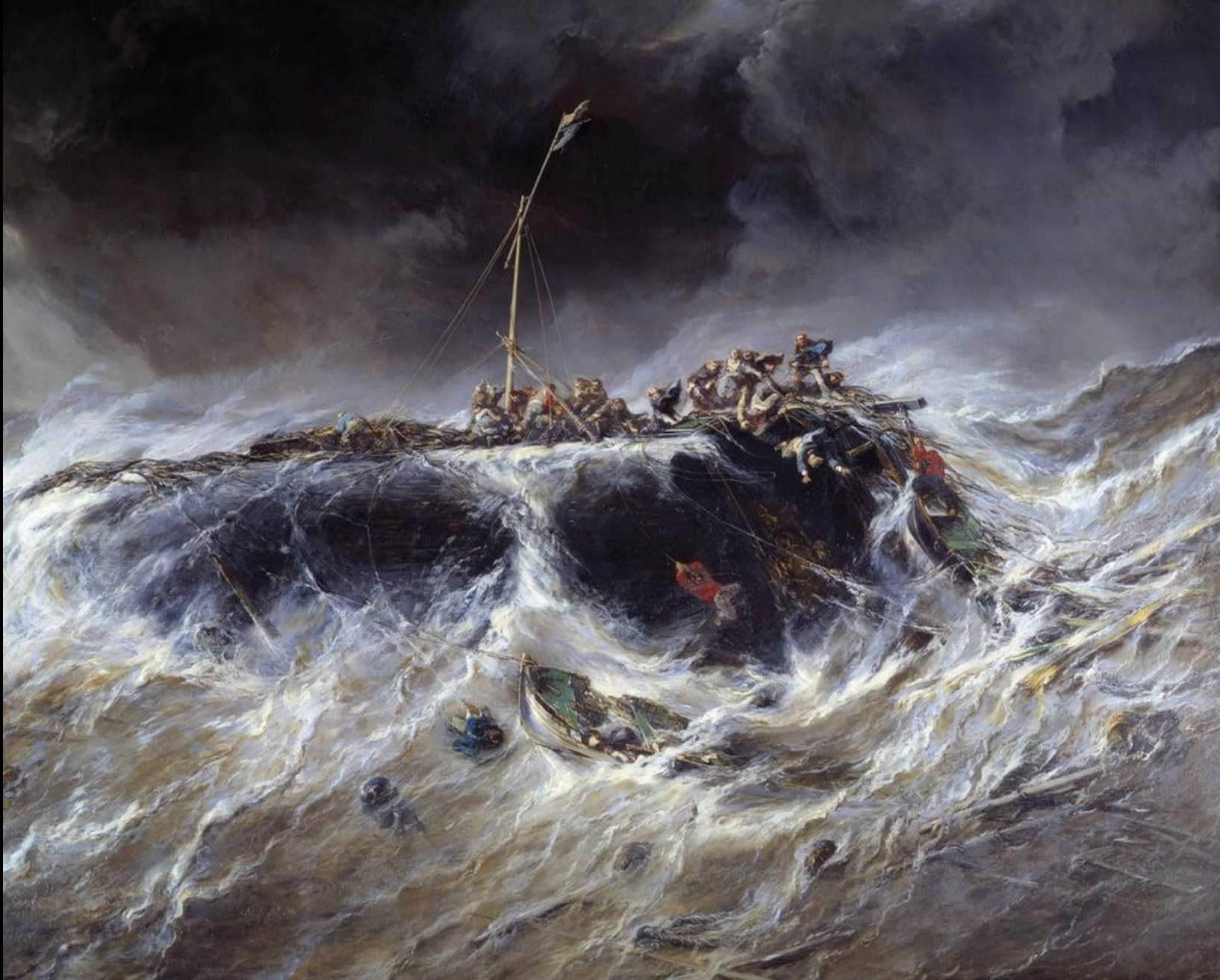
Eugène Isabey, Το Ναυάγιο του Emily, 1865, λάδι σε καμβά, 200x345 εκ., Μουσείο Καλών Τεχνών, Nantes Γαλλία