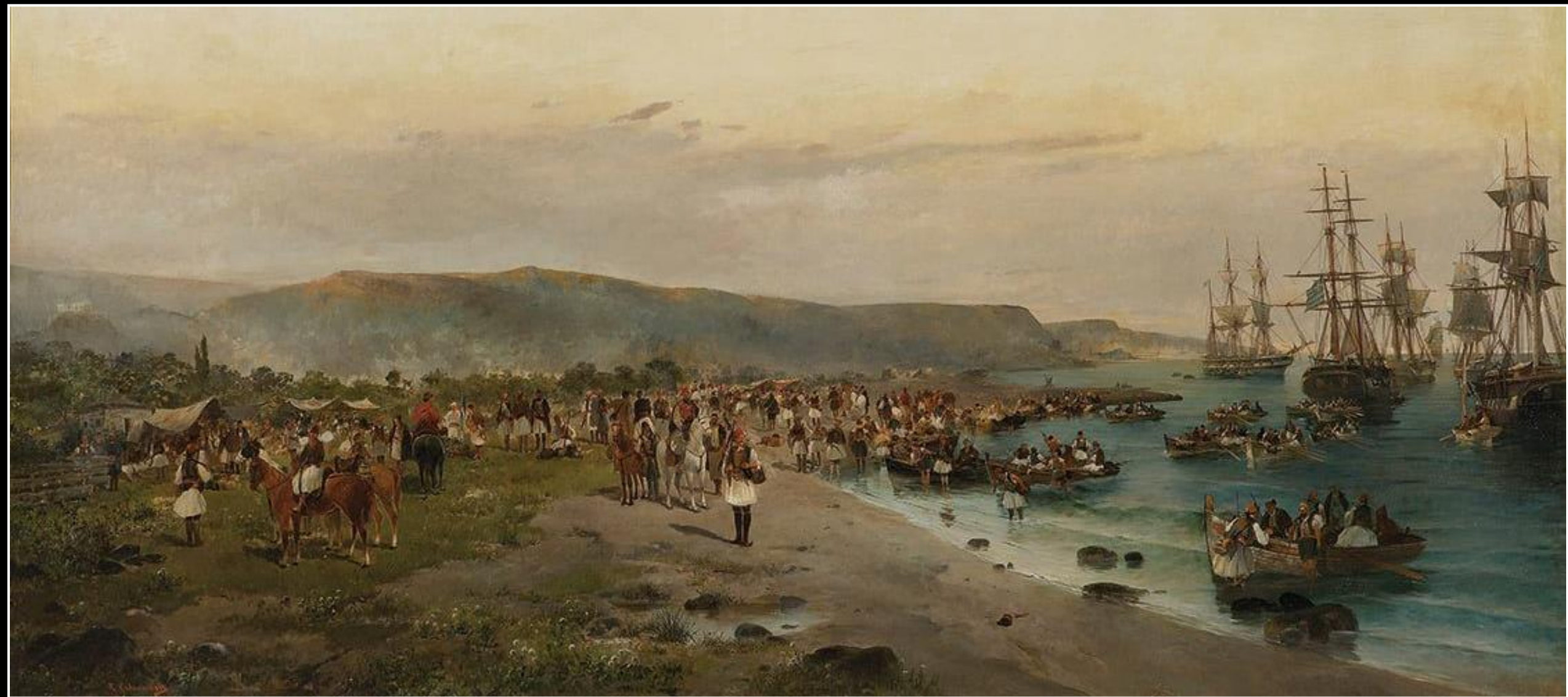
Κωνσταντίνος Βολανάκης, Η αποβίβαση του Καραϊσκάκη στο Φάληρο, 1895, λάδι σε καμβά, 150x273 εκ., Συλλογή της Τράπεζας της Ελλάδος, Αθήνα