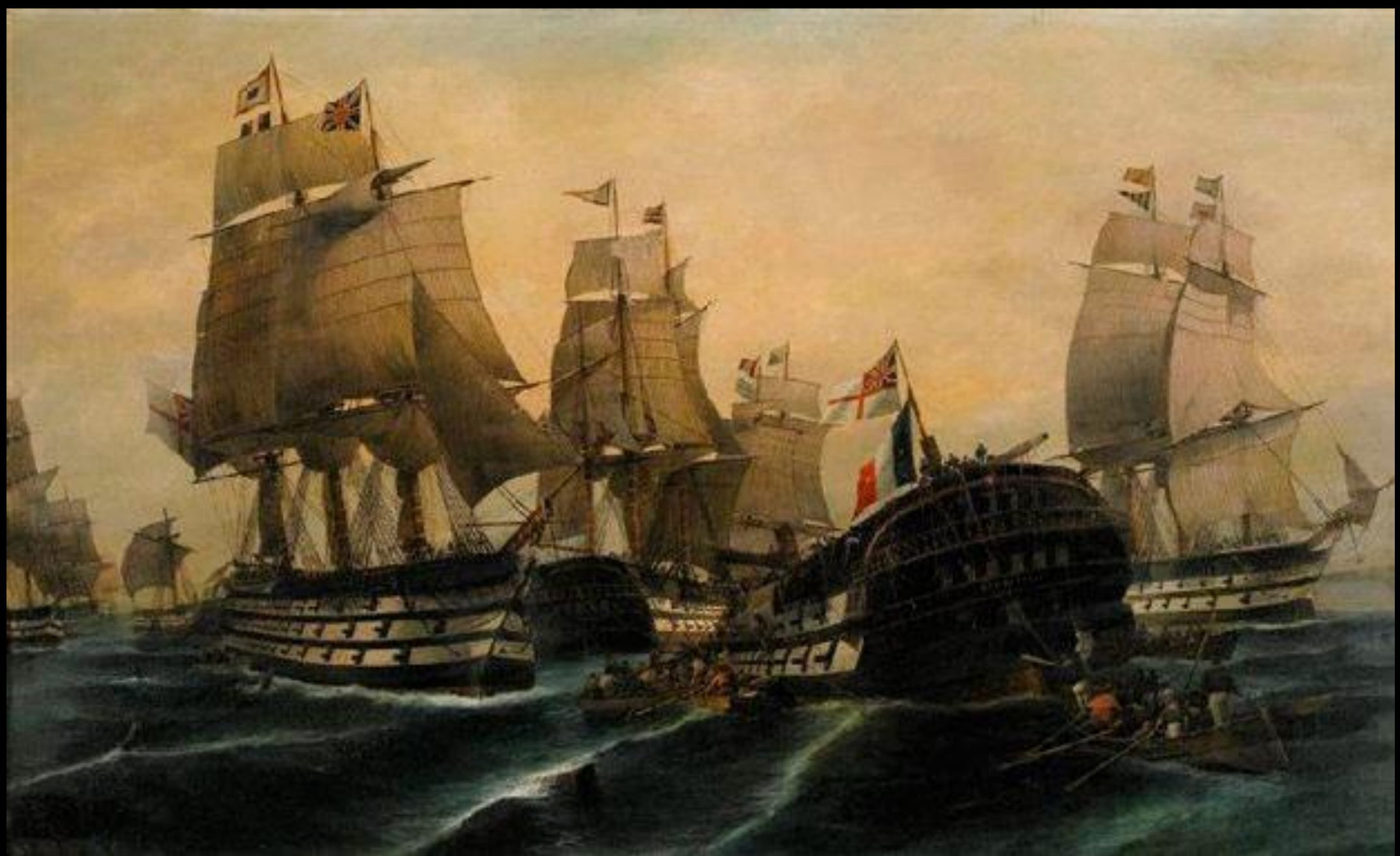
Κωνσταντίνος Βολανάκης, Η Ναυμαχία του Τραφάλγκαρ, 1805, λάδι σε καμβά, Ιδιωτική Συλλογή