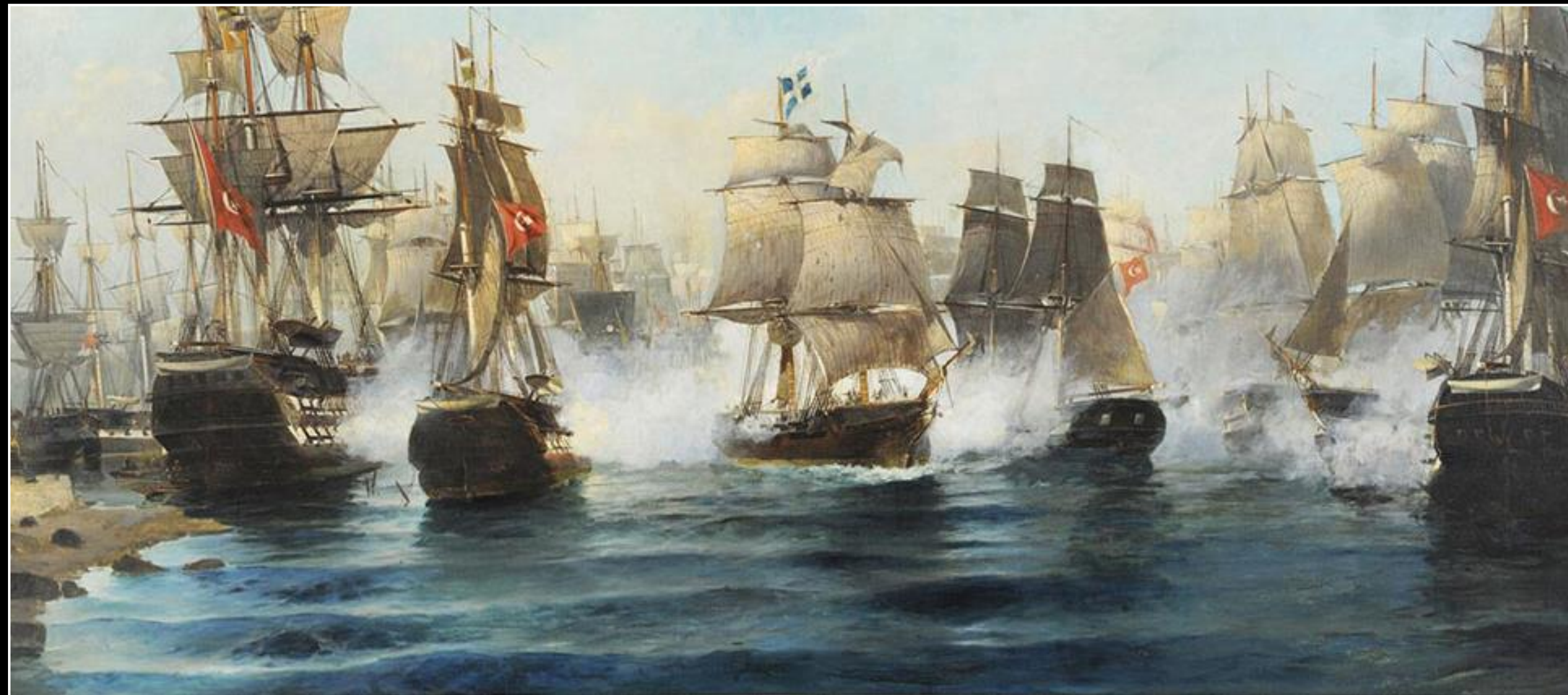
Κωνσταντίνος Βολανάκης, Η έξοδος του Άρεως, 1894, λάδι σε καμβά, 110x191 εκ., Εθνική Πινακοθήκη, Αθήνα