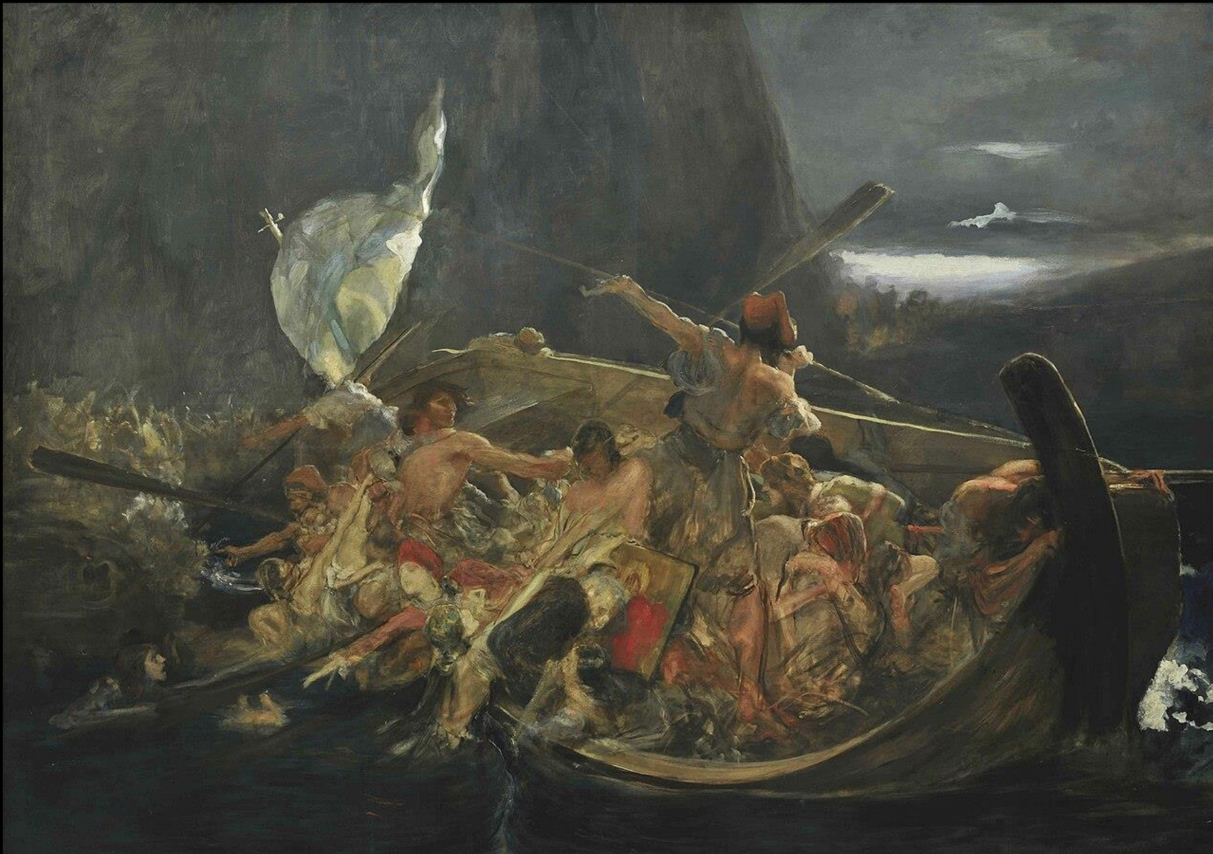
Νικόλαος Γύζης, Μετά την Καταστροφή των Ψαρών, π. 1896 – 1898, λάδι σε καμβά, 133x188, Εθνική Πινακοθήκη, Αθήνα