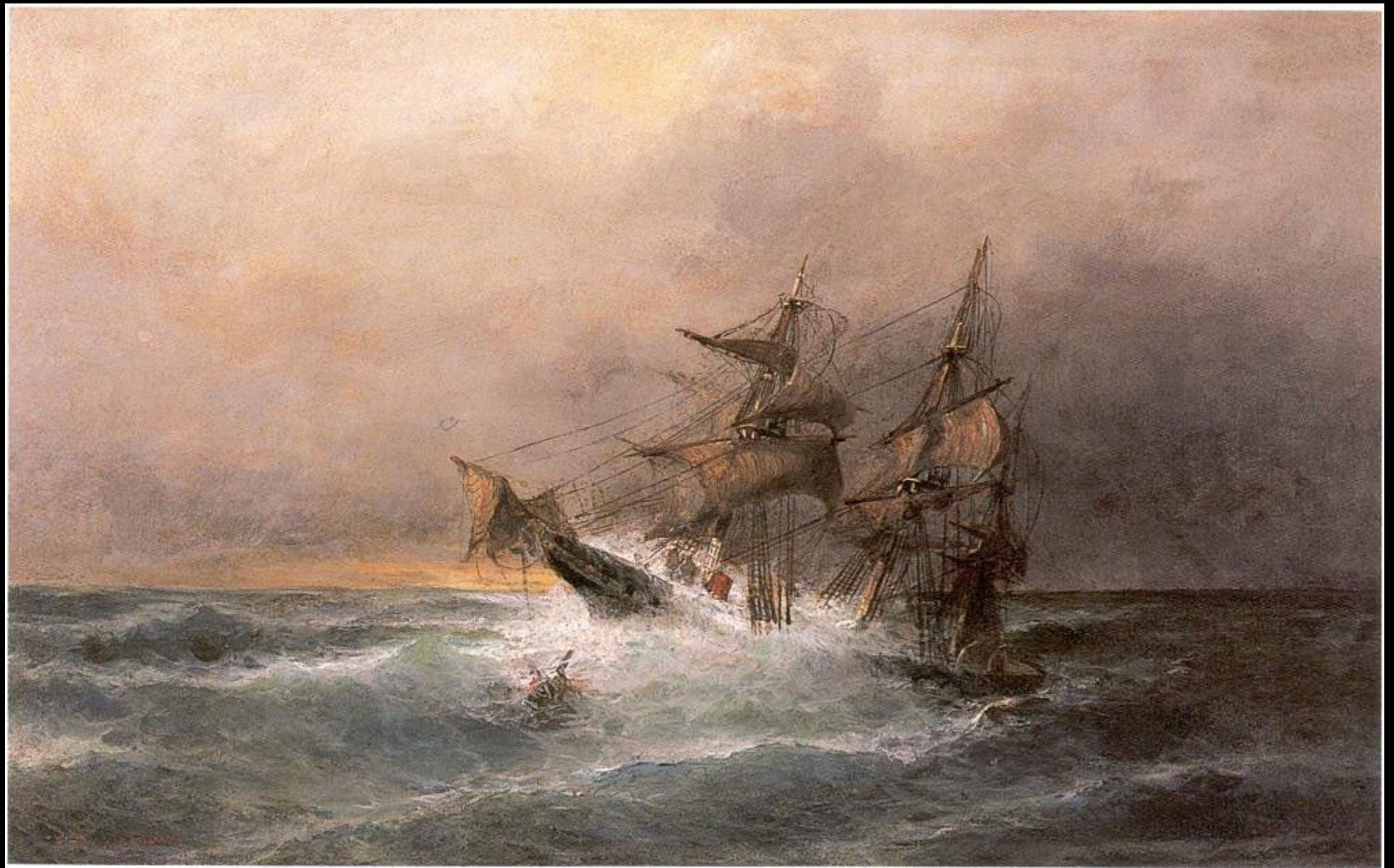
Κωνσταντίνος Βολανάκης, Καράβι σε Τρικυμία, λάδι σε καμβά, Ιδιωτική Συλλογή