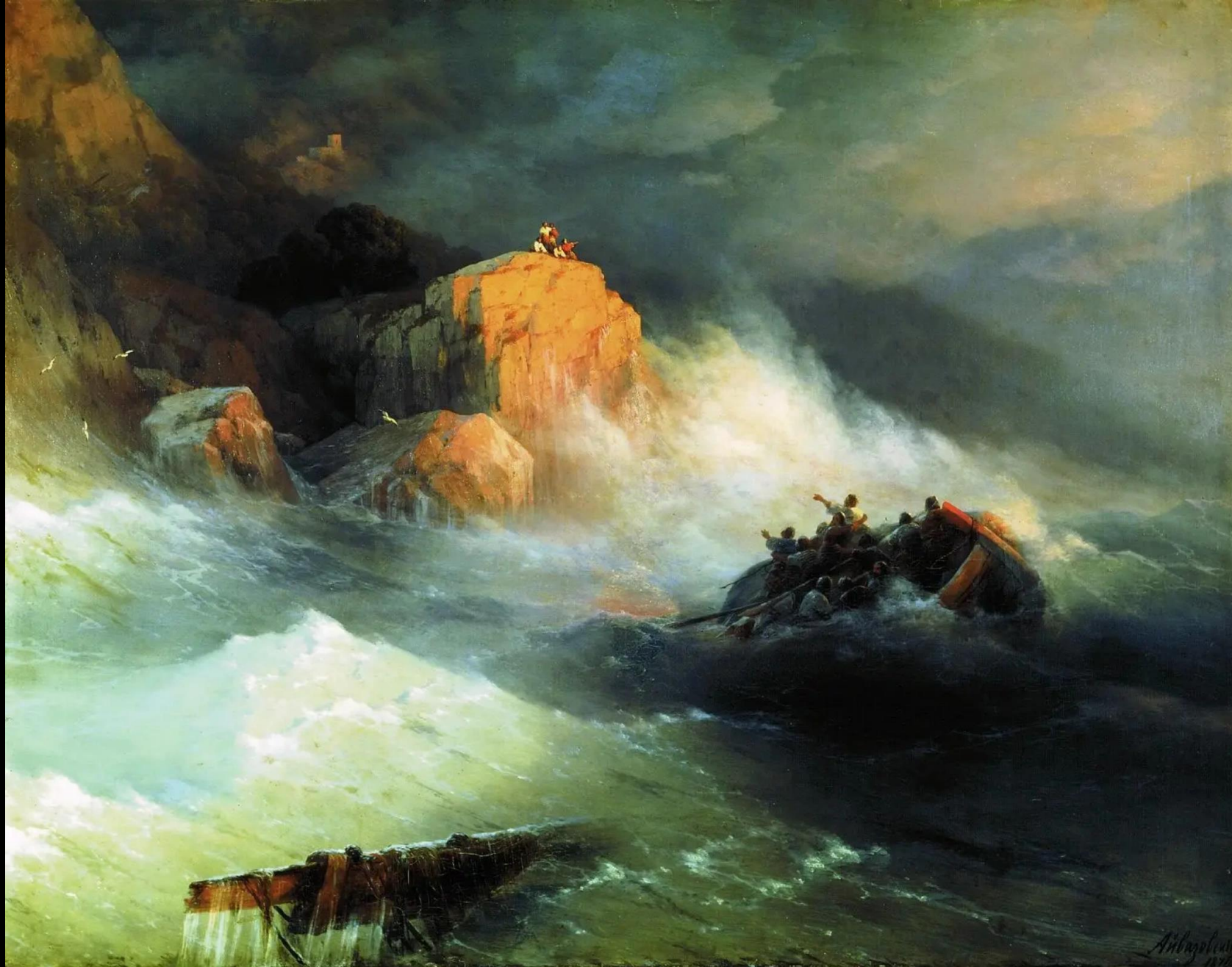
Ιβαν Αϊβάζονσκι, Ναυάγιο, 1876, λάδι σε καμβά, 136x170 εκ., Feodosia Art Gallery