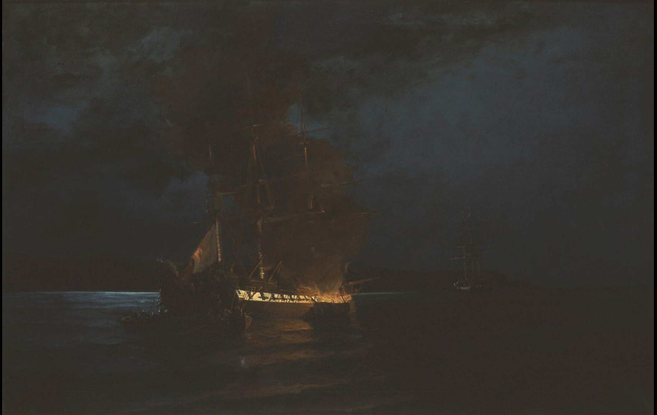
Κωνσταντίνος Βολανάκης, Η Πυρπόληση της Τουρκικής Ναυαρχίδας, λάδι σε καμβά, 70x 110 εκ., Εθνική Πινακοθήκη, Αθήνα