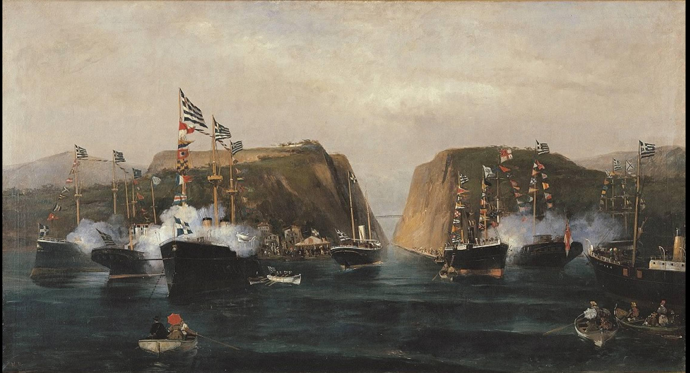
Κωνσταντίνος Βολανάκης, Τα εγκαίνια της διώρυγας της Κορίνθου, 1893, λάδι σε καμβά, 86x158 εκ., Συλλογή της Alpha Bank, Αθήνα