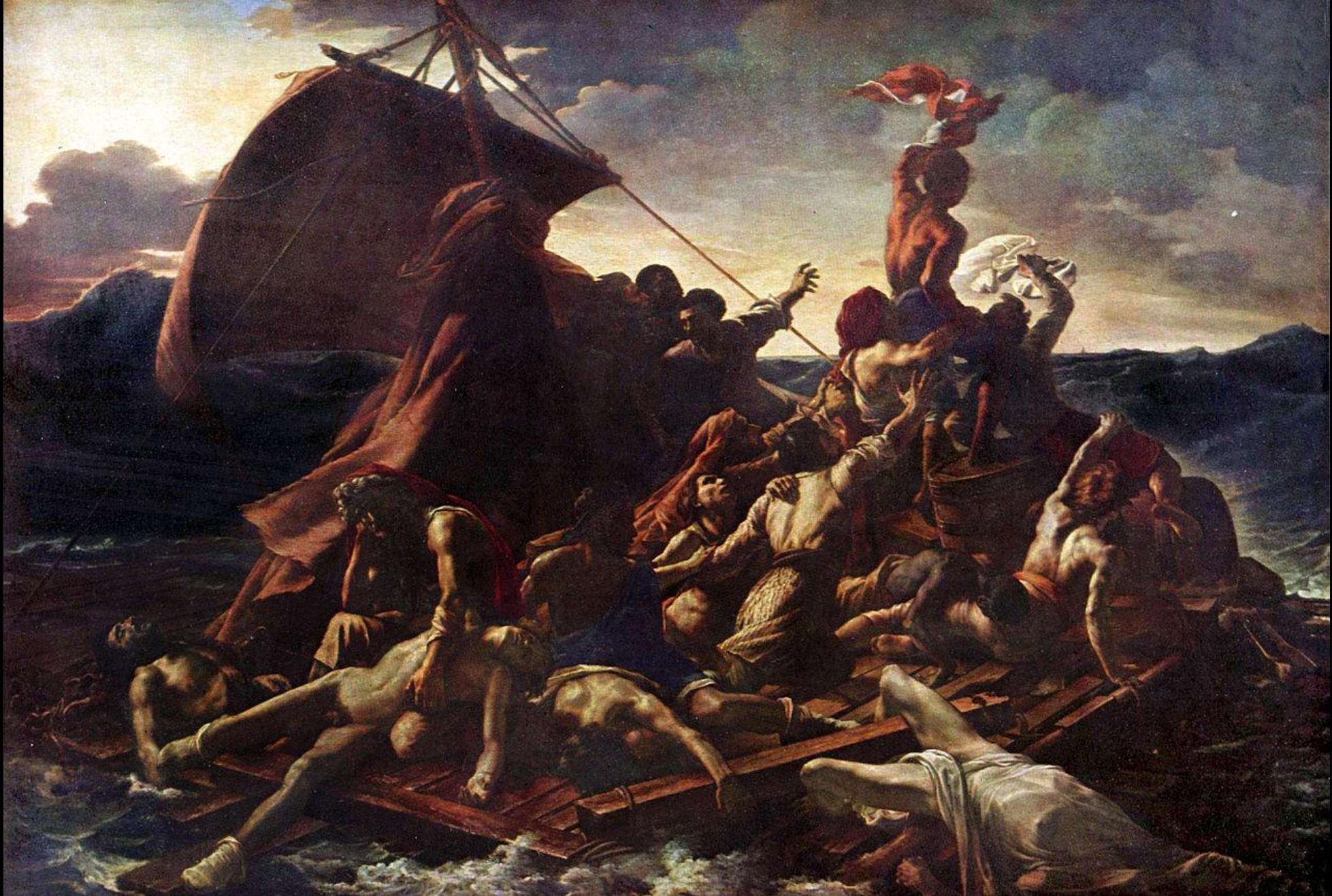
Théodore Géricault, Το Ναυάγιο της Μέδουσας, 1819, λάδι σε καμβά, 491x716, Μουσείο Λούβρου, Παρίσι