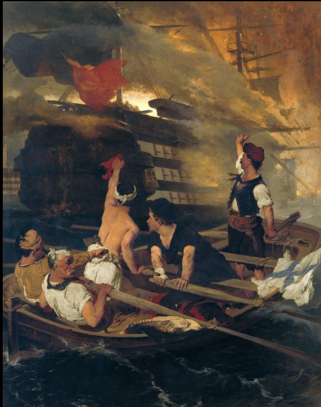
Νικηφόρος Λύτρας, Η Πυρπόληση της Τουρκικής Ναυαρχίδας από τον Κανάρη, λάδι σε καμβά, 143x109 εκ., Πινακοθήκη Αβέρωφ, Μέτσοβο