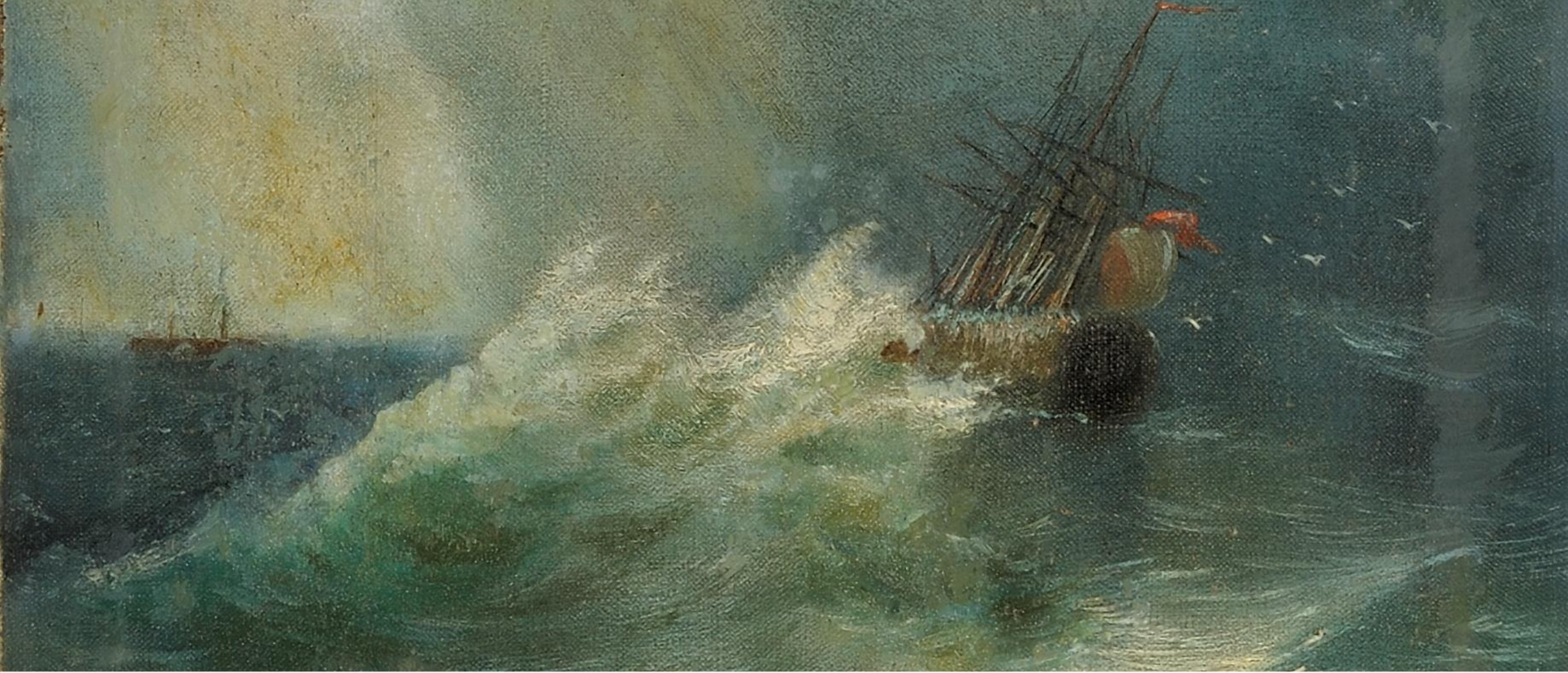
Ivan Aivazovsky, Πλοίο σε καταιγίδα, λάδι σε καμβά, Συλλογή Ιδρύματος Αικατερίνης Λασκαρίδη