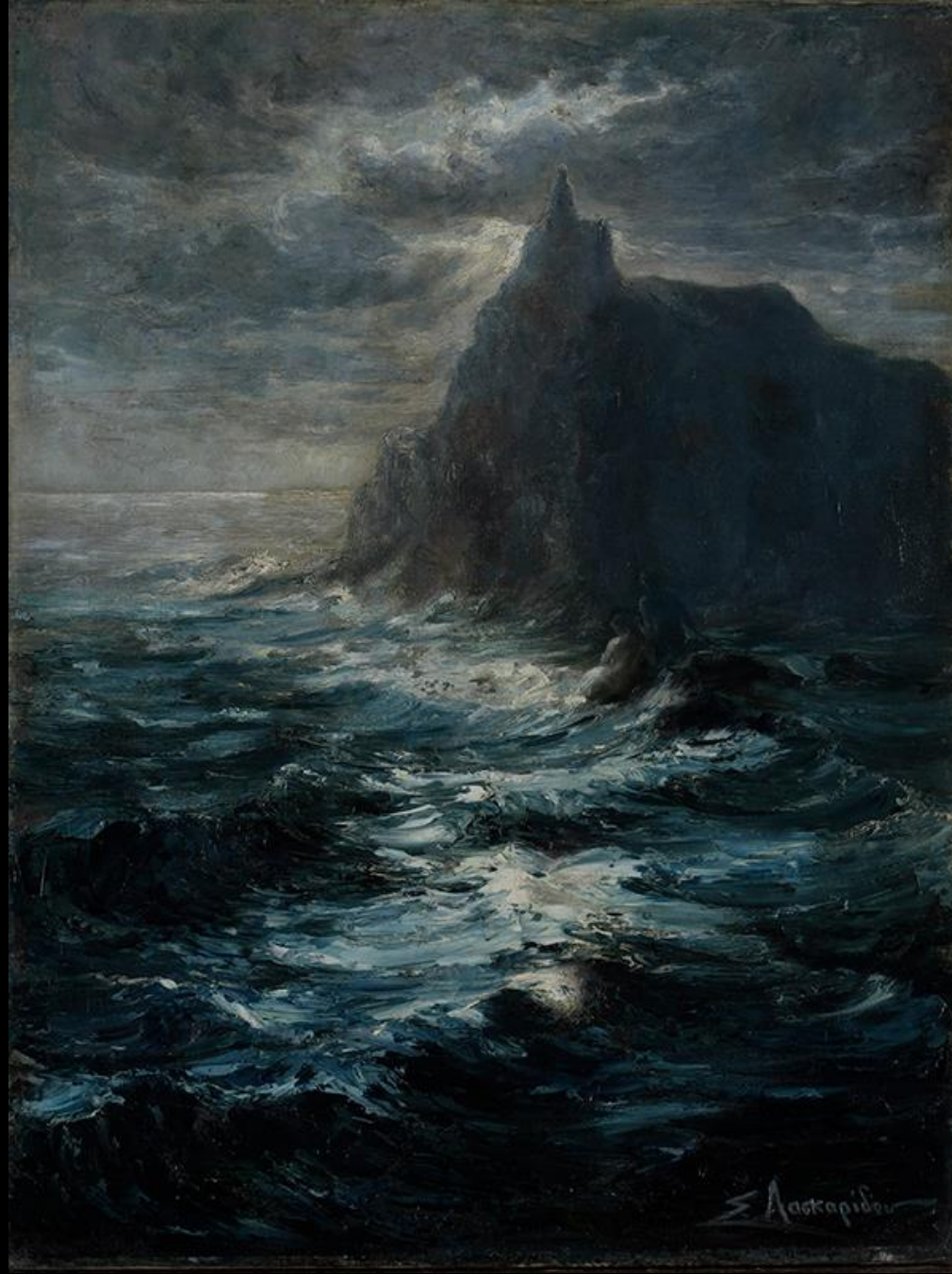
Σοφία Λασκαρίδου, Νυχτερινή Φαντασία (Ο Κάβος της Κυράς), λάδι σε καμβά, Συλλογή της Τράπεζας της Ελλάδος