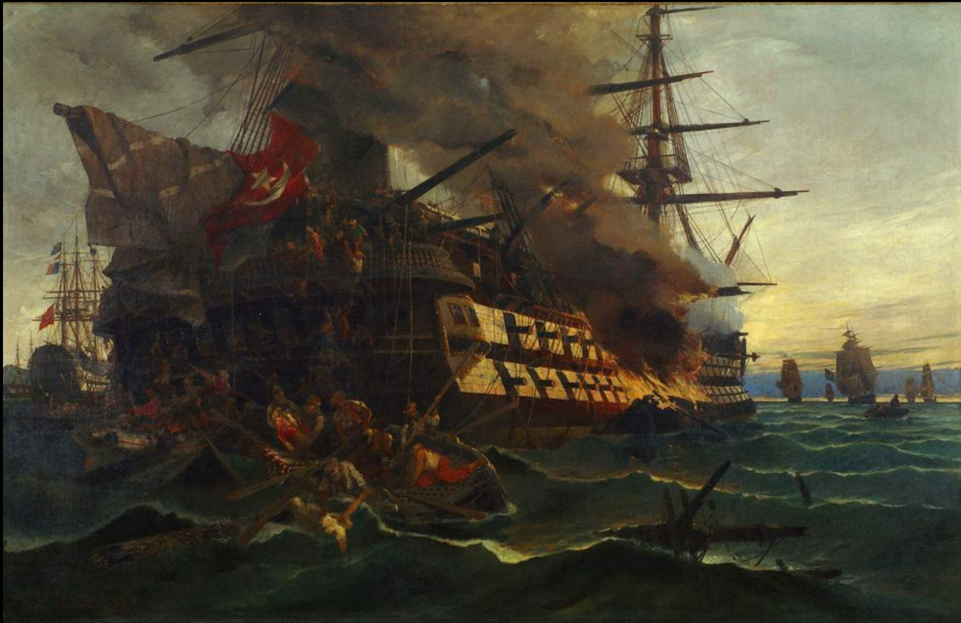
Κωνσταντίνος Βολανάκης, Η Πυρπόληση του τουρκικού δικρότου στην Ερεσό, 1882, λάδι σε καμβά, Συλλογή Ναυτικού Μουσείου της Ελλάδος