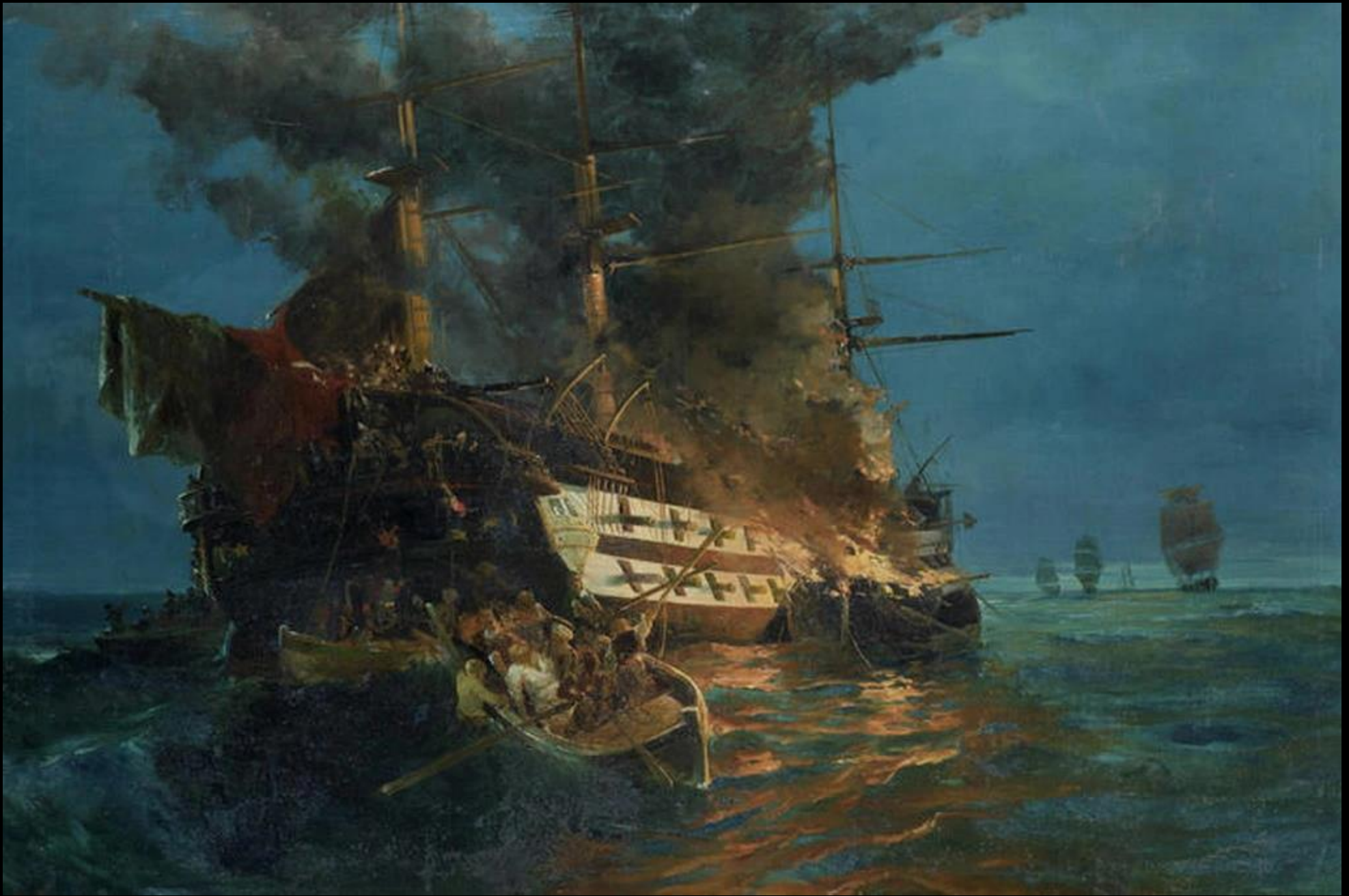
Κωνσταντίνος Βολανάκης, Η Πυρπόληση του τουρκικού δικρότου, λάδι σε καμβά, Ιδιωτική Συλλογή