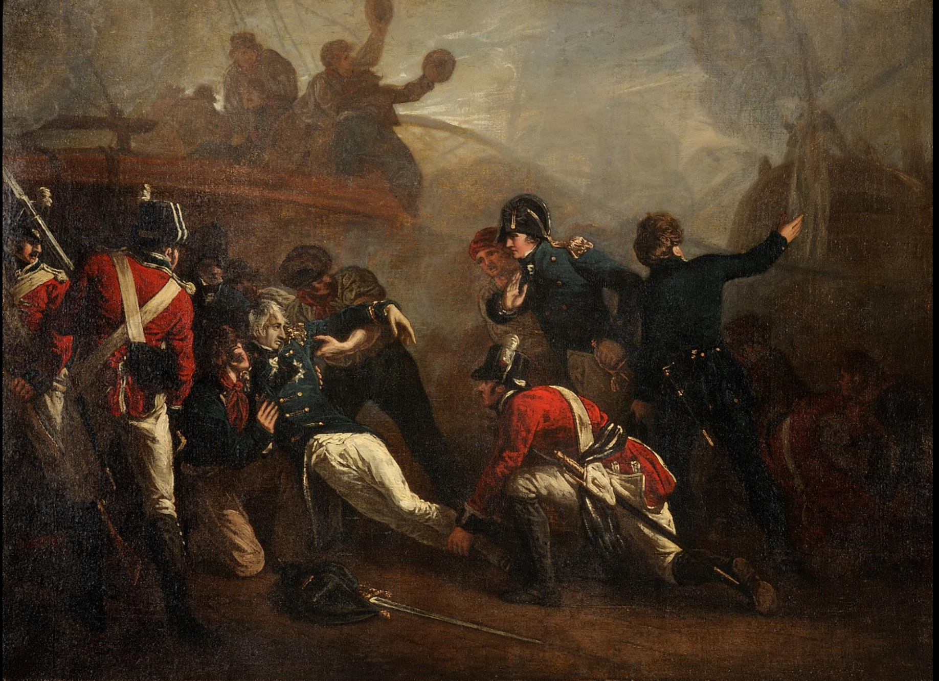
Henry Singleton, Ο θάνατος του Nelson, λάδι σε καμβά, Συλλογή Ιδρύματος Αικατερίνης Λασκαρίδη