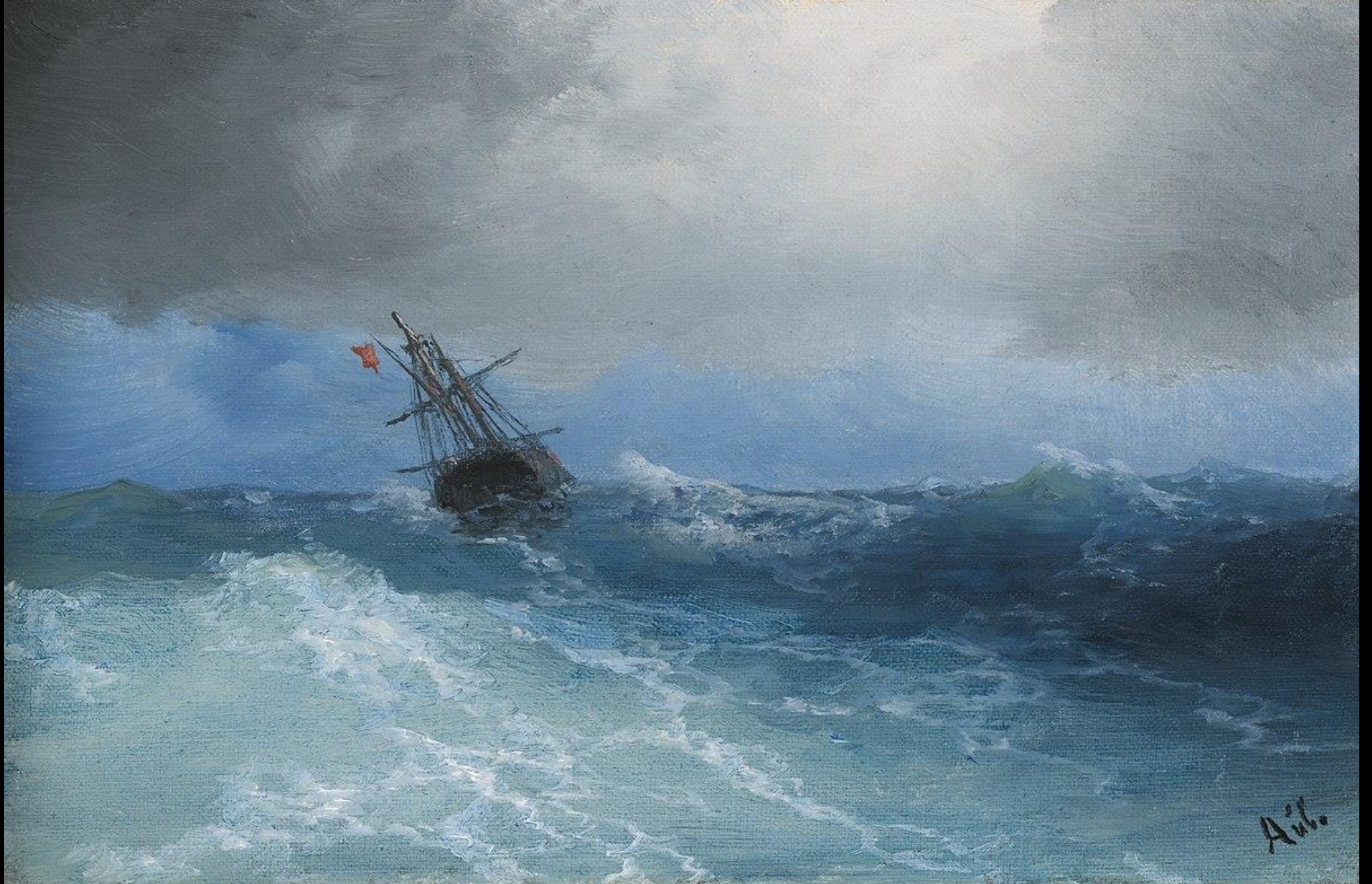
Ιβαν Αϊβάζονσκι, Πλοίο στην καταιγίδα, 1899, λάδι σε καμβά, 17x25.5 εκ., Ιδιωτική Συλλογή