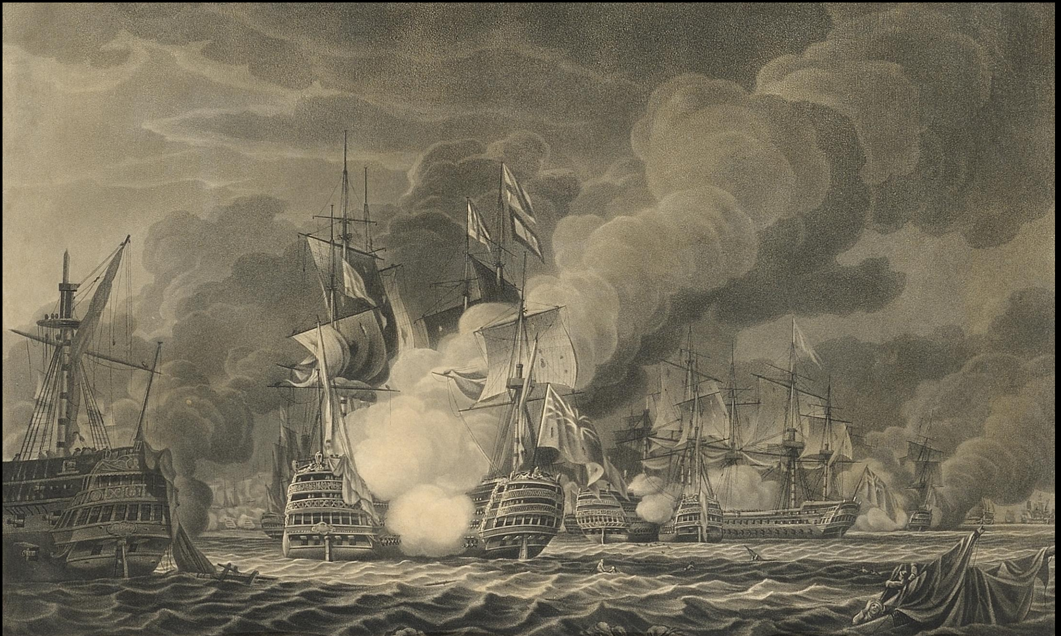
J. W. Edy After R. Cleveley, Η Ναυμαχία του Τραφάλγκαρ, Συλλογή Ιδρύματος Αικατερίνης Λασκαρίδη