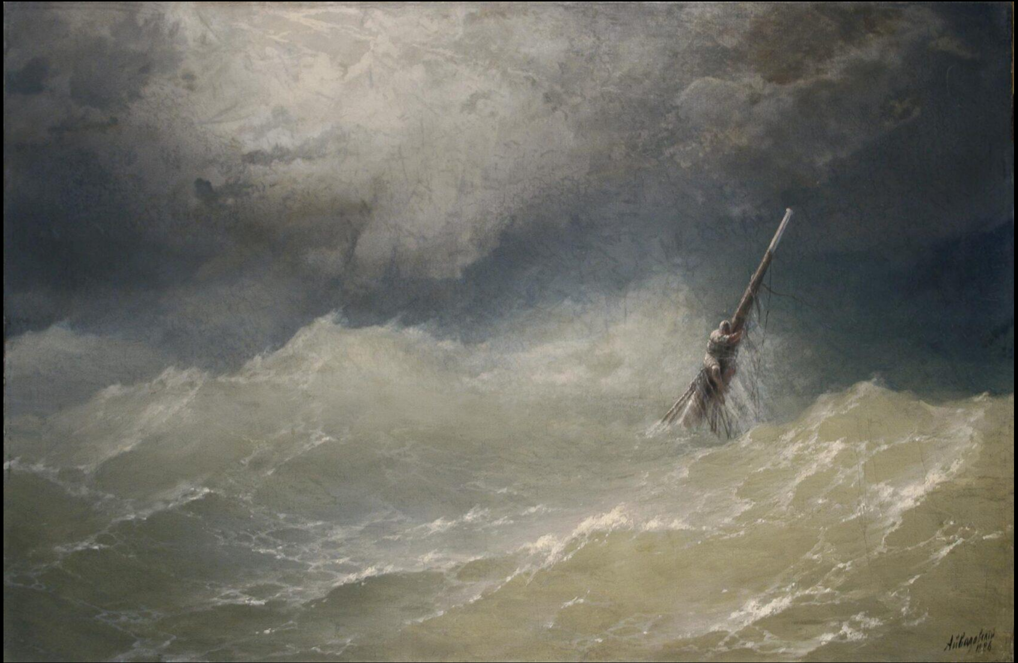
Ivan Aivazovsky, Ναυάγιο, 1886, λάδι σε καμβά, 94x144 εκ., Εθνική Πινακοθήκη, Αθήνα