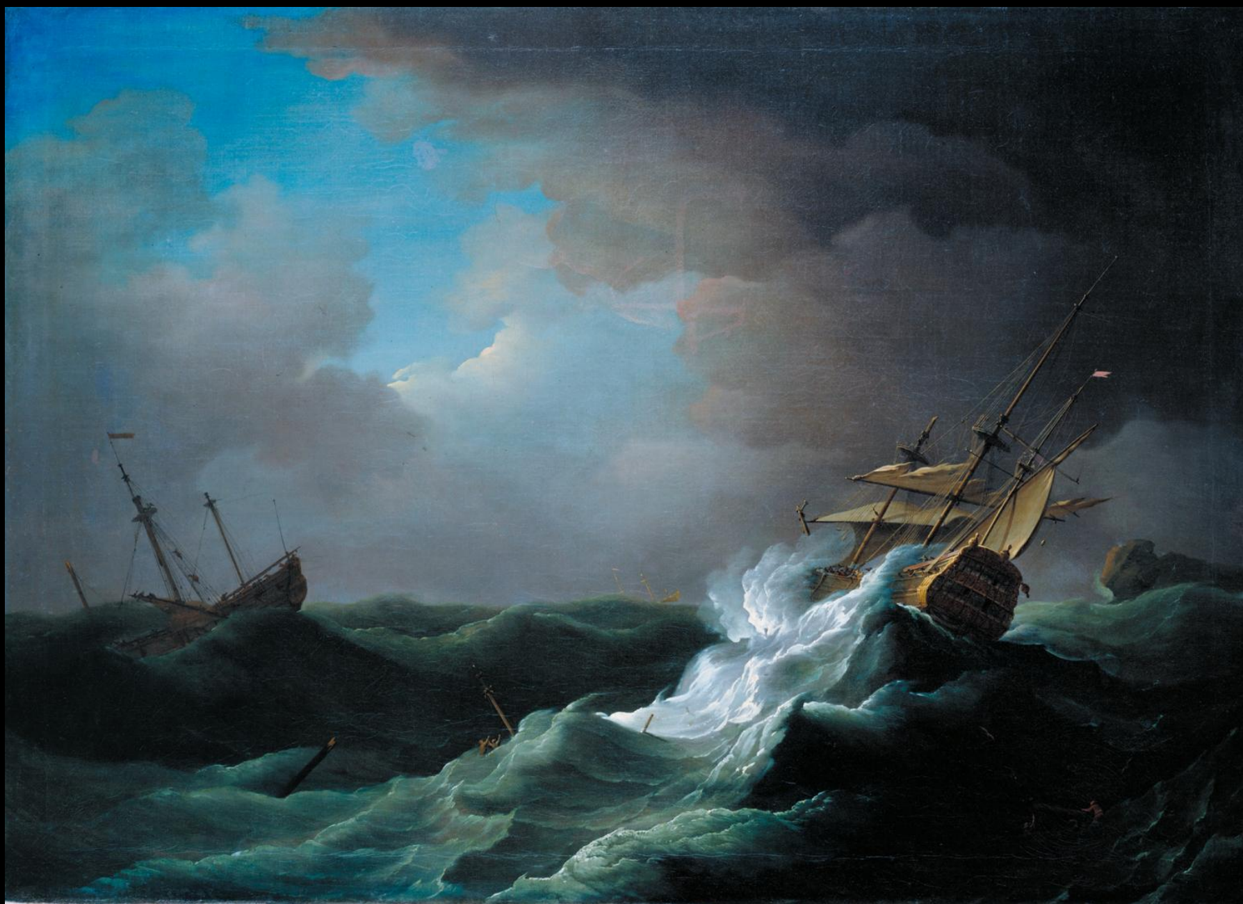
Peter Monamy, Πλοία σε καταιγίδα, 1720 – 1730, λάδι σε καμβά, 765x164 εκ., Tate Britain, Λονδίνο