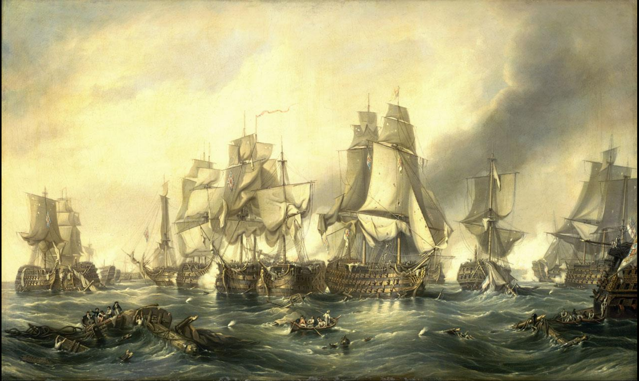
William Clarkson Stanfield, Η Ναυμαχία του Τραφάλγκαρ, 1836, λάδι σε καμβά, 735x12.05 εκ., National Maritime Museum, Greenwich Λονδίνο