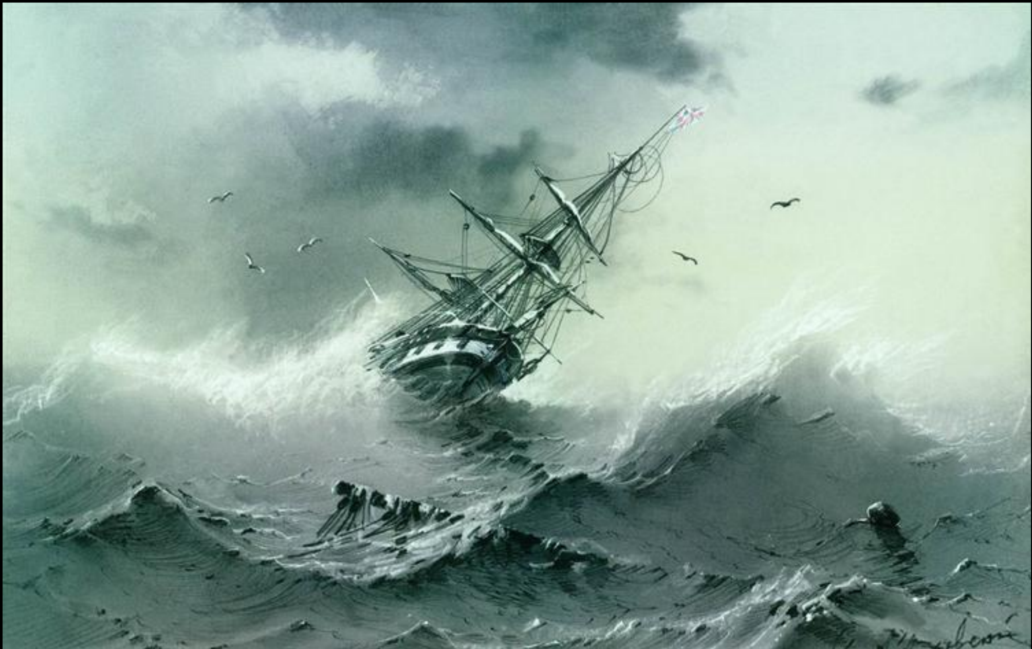
Ιβαν Αϊβάζονσκι, Ναυάγιο, μολύβια σε χαρτί, Russian Museum, Αγία Πετρούπολη