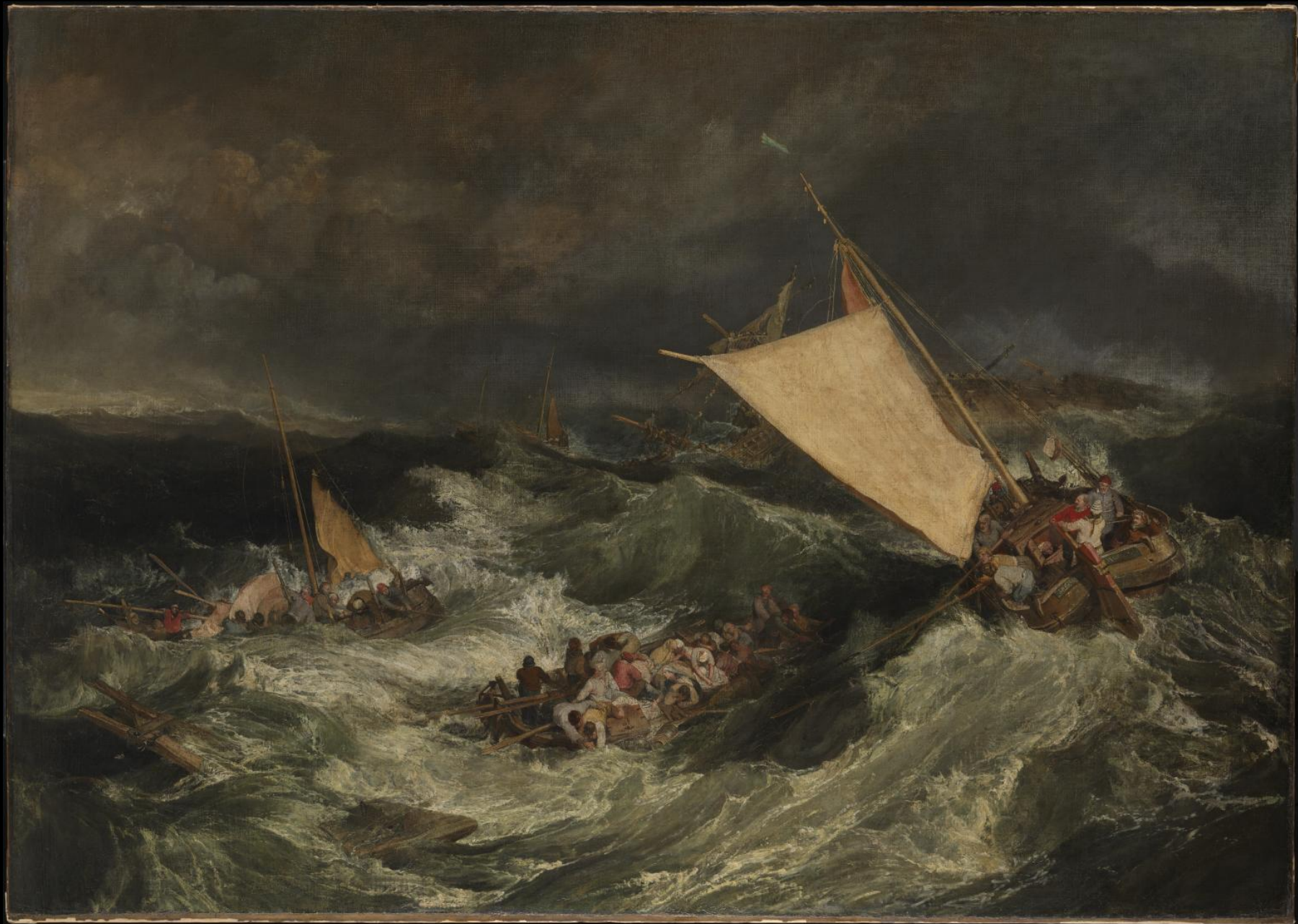
Joseph Mallord William Turner, Το Ναυάγιο, 1805, λάδι σε καμβά, 175x246 εκ., Tate Britain, Λονδίνο