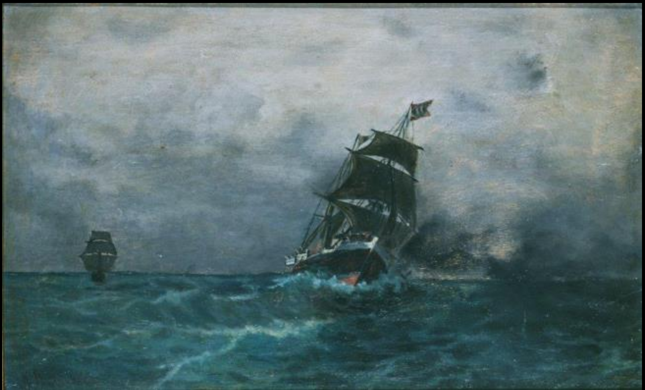
Κωνσταντίνος Βολανάκης, Ιστιοφόρο, λάδι σε ξύλο, 15.5x25.2 εκ., Πανακοθήκη Αβέρωφ, Μέτσοβο