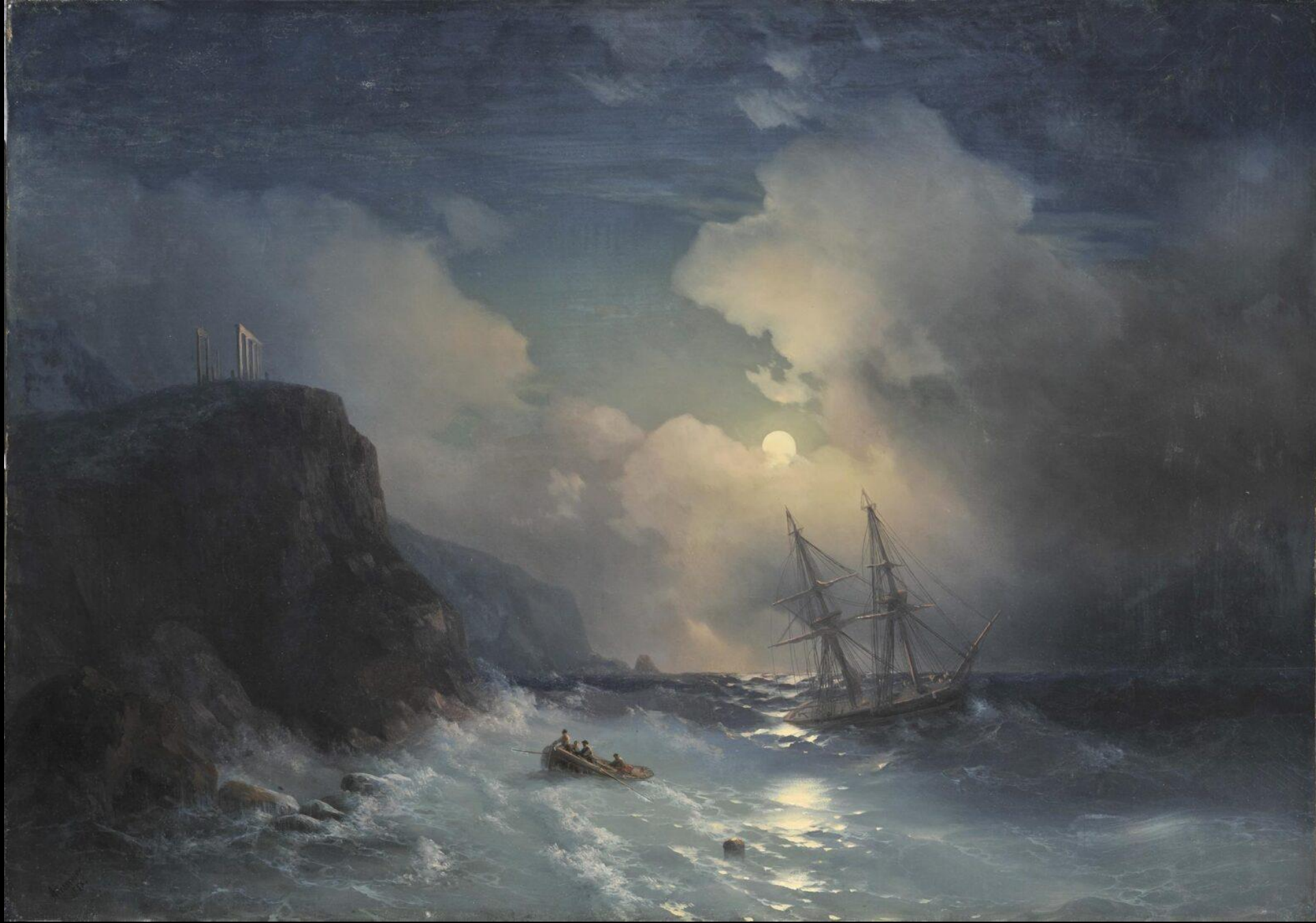
Ιβαν Αϊβάζονσκι, Το Σούνιο με τρικυμία, 1856, λάδι σε καμβά, 59x83 εκ., Εθνική Πινακοθήκη, Αθήνα