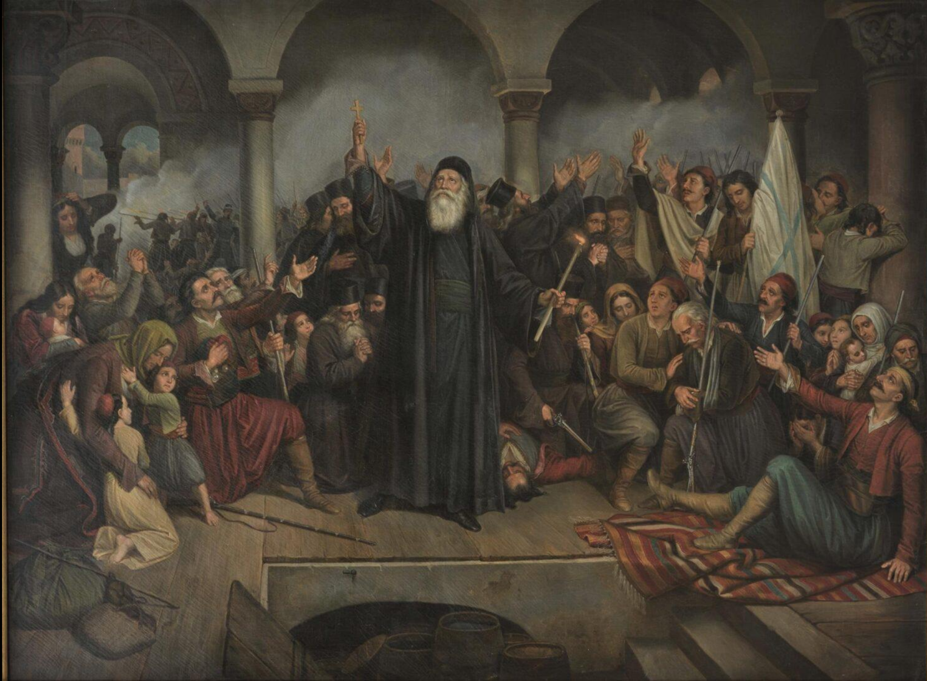
Θεόδωρος Βρυζάκης, Η Μονή Αρκαδίου, π. 1867, λάδι σε καμβά, 128x173 εκ., Εθνική Πινακοθήκη, Αθήνα