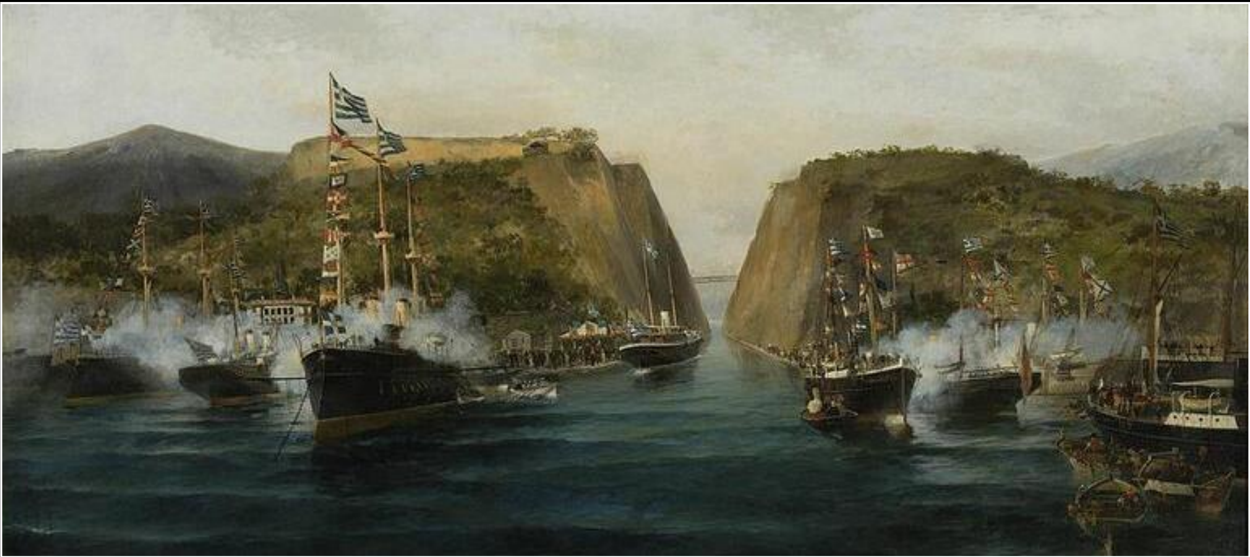
Κωνσταντίνος Βολανάκης, Τα εγκαίνια της διώρυγας της Κορίνθου, 1893, λάδι σε καμβά, 127x200 εκ., Συλλογή της Τράπεζας της Ελλάδος, Αθήνα