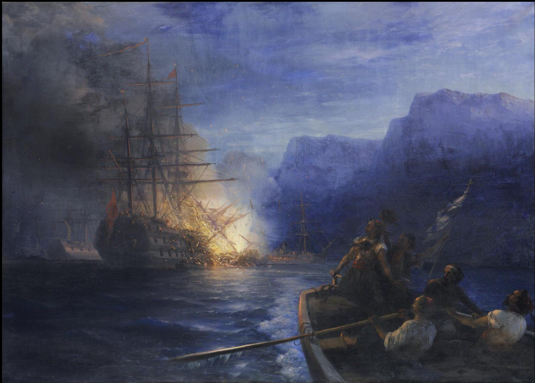
Ιβαν Αιβάζονσκι, Η Πυρπόληση της Τουρκικής Ναυαρχίδας από τον Κωνσταντίνο Κανάρη, 1811, λάδι σε καμβά, 182x223 εκ., Εθνική Πνακοθήκη, Αθήνα