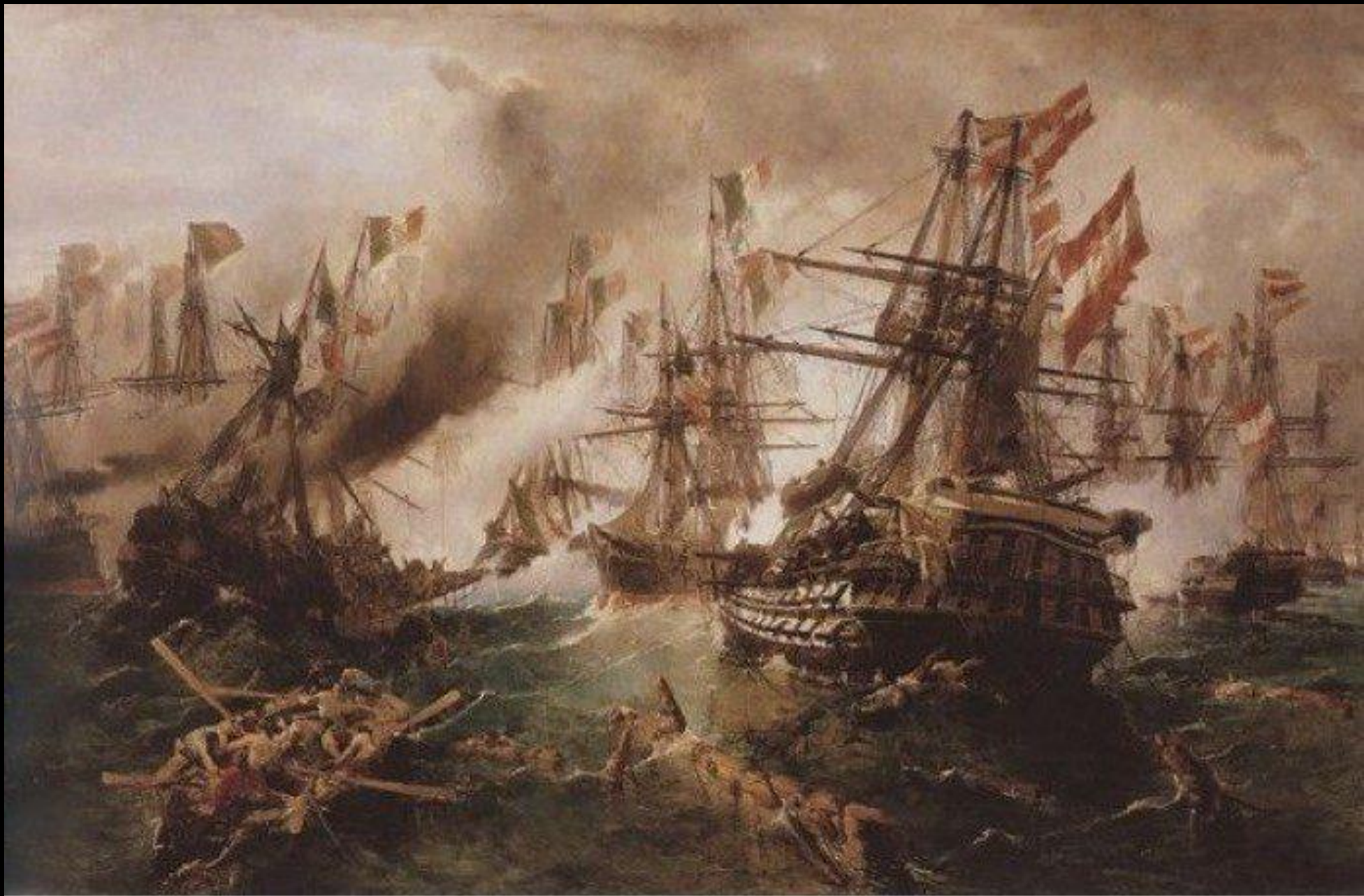
Κωνσταντίνος Βολανάκης, Η Ναυμαχία της Λίσσας, 1868, λάδι σε καμβά, 169x283 εκ., Μουσείο Καλών Τεχνών, Βουδαπέστη