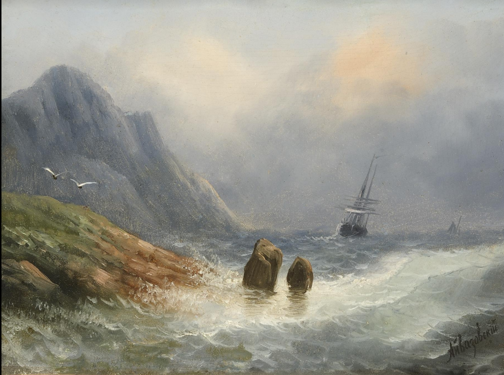
Ιvan Αϊβαζονsky, Πλοίο σε τρικυμία, λάδι σε καμβά, Συλλογή Ιδρύματος Αικατερίνης Λασκαρίδη