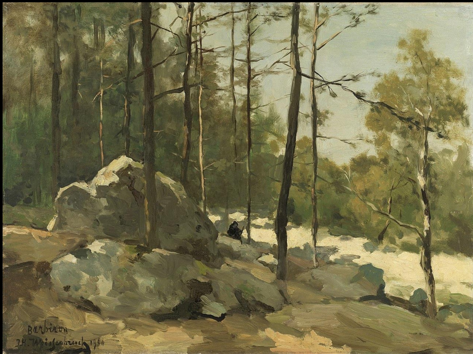
Jean Hendrik Weissenbruch, Θέα δάσους κοντά στην Barbizon, 1900, λάδι σε καμβά, 48.5x64 εκ., Rijksmuseum, Άμστερνταμ