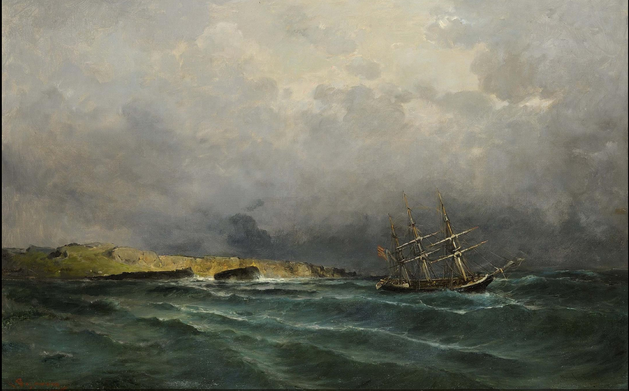
Κωνσταντίνος Βολανάκης, Πλέοντας στα ανοιχτά, λάδι σε καμβά, 54.5x81 εκ., Συλλογή Ιδρύματος Αικατερίνης Λασκαρίδη