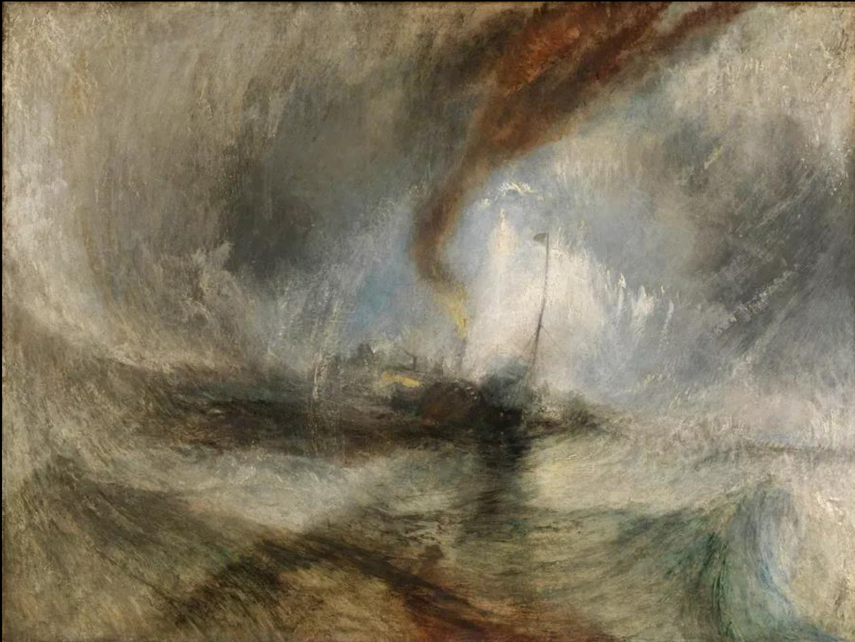
Joseph Mallord William Turner, Χιονοθύελλα – Ατμόπλοιο έξω από την είσοδο του Λιμανιού, 1842, λάδι σε καμβά, Tate Britain, Λονδίνο