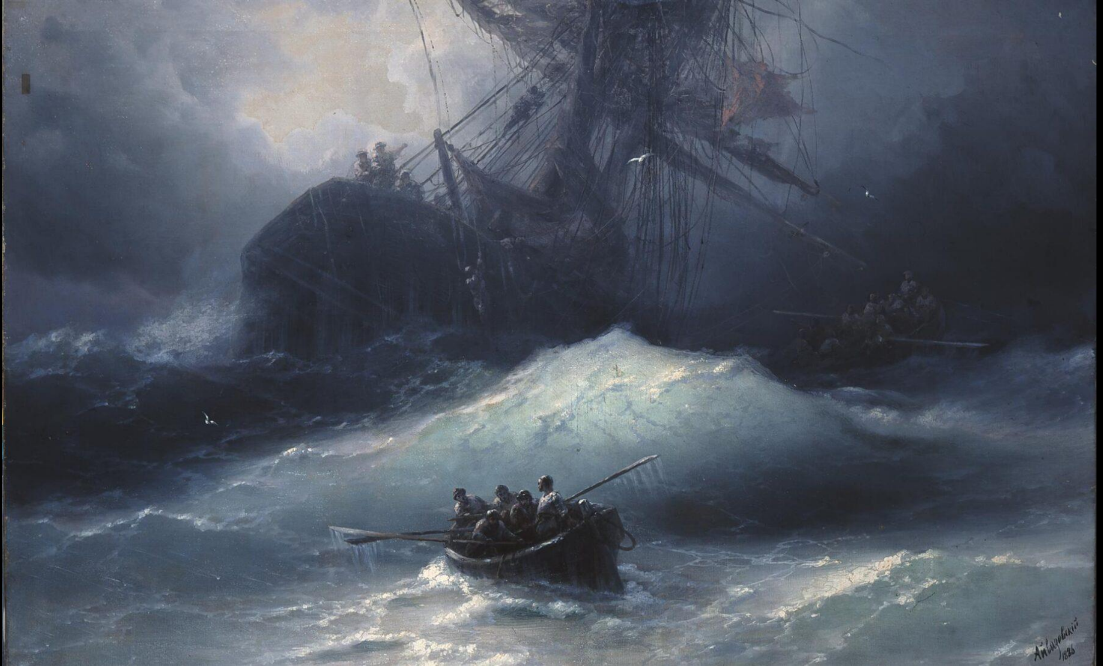
Ιβαν Αϊβάζονσκι, Ναυάγιο, 1886, λάδι σε καμβά, 93x145 εκ., Εθνική Πινακοθήκη, Αθήνα