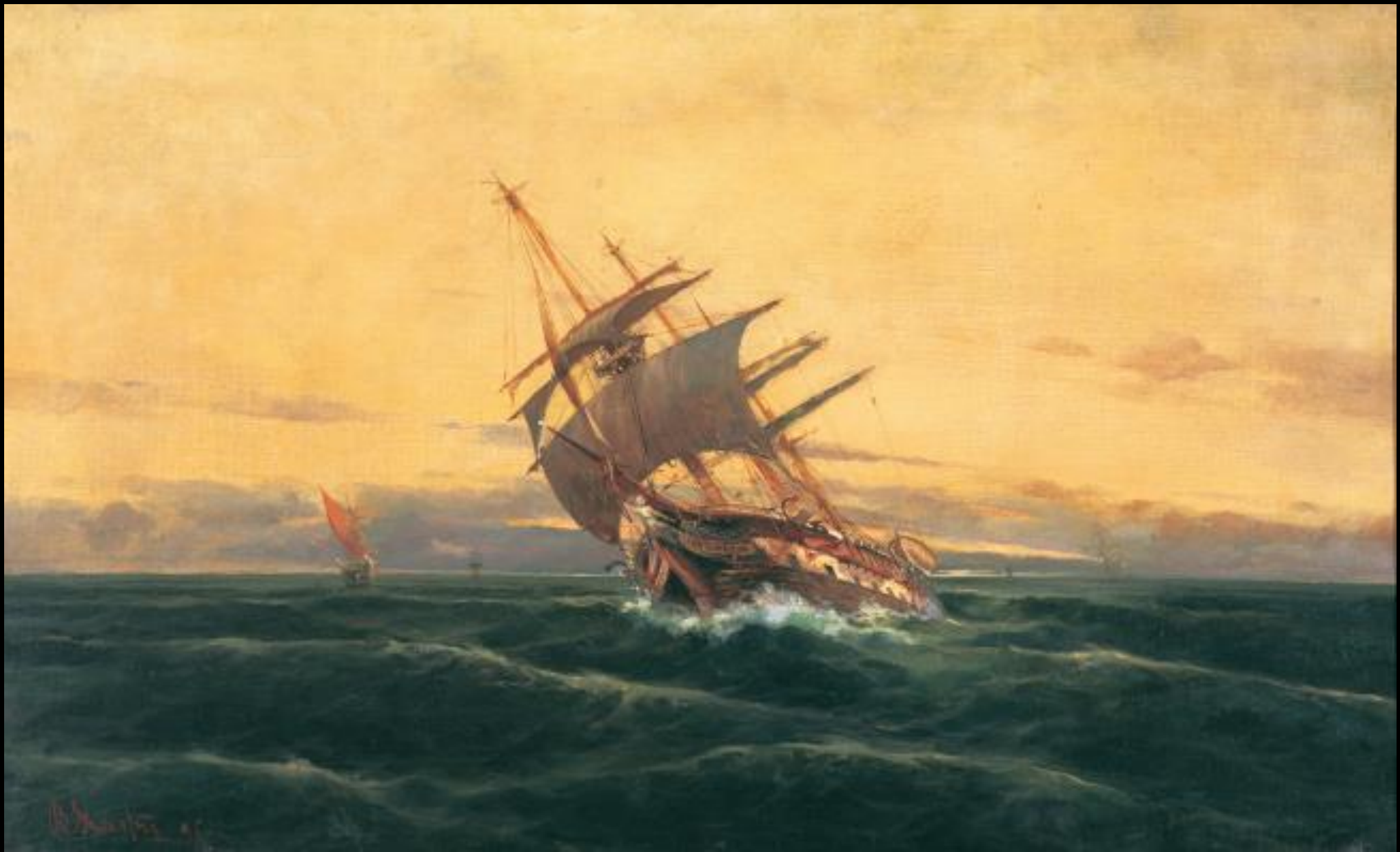
Βασίλειος Χατζής, Πλοίο σε καταιγίδα, 1896, λάδι σε καμβά, 60x97 εκ., Πινακοθήκη Αβέρωφ, Μέτσοβο