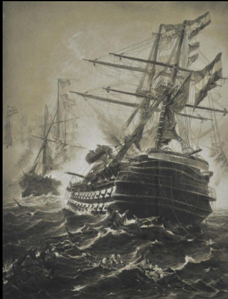
Ιωάννης Αλταμούρας, Ναυάγιο, μολυβοκάρβουνο σε χαρτόνι, 61.5x47 εκ., Εθνική Πινακοθήκη, Αθήνα