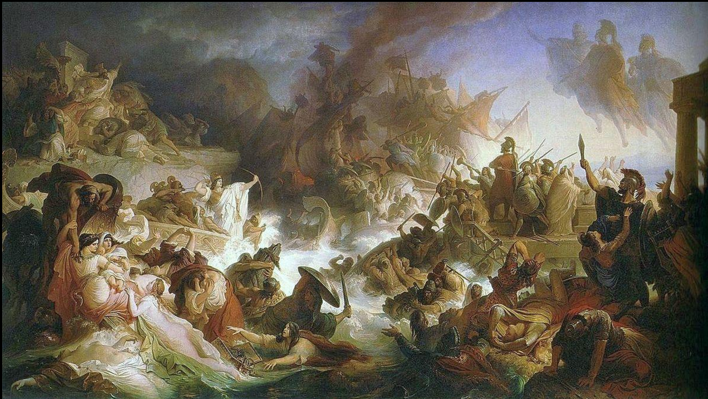
Wilhelm von Kaulbach, Η Ναυμαχία της Σαλαμίνας, 1864, λάδι σε καμβά, 560x980 εκ., Maximilianeum, Μόναχο