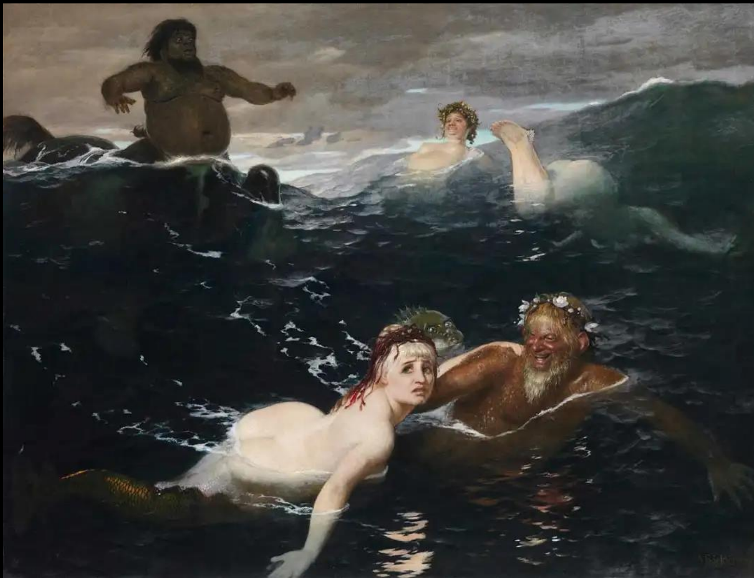
Arnold Böcklin, Παιχνίδι στα κύματα, 1883, λάδι σε καμβά, Neue Pinakothek, Μόναχο