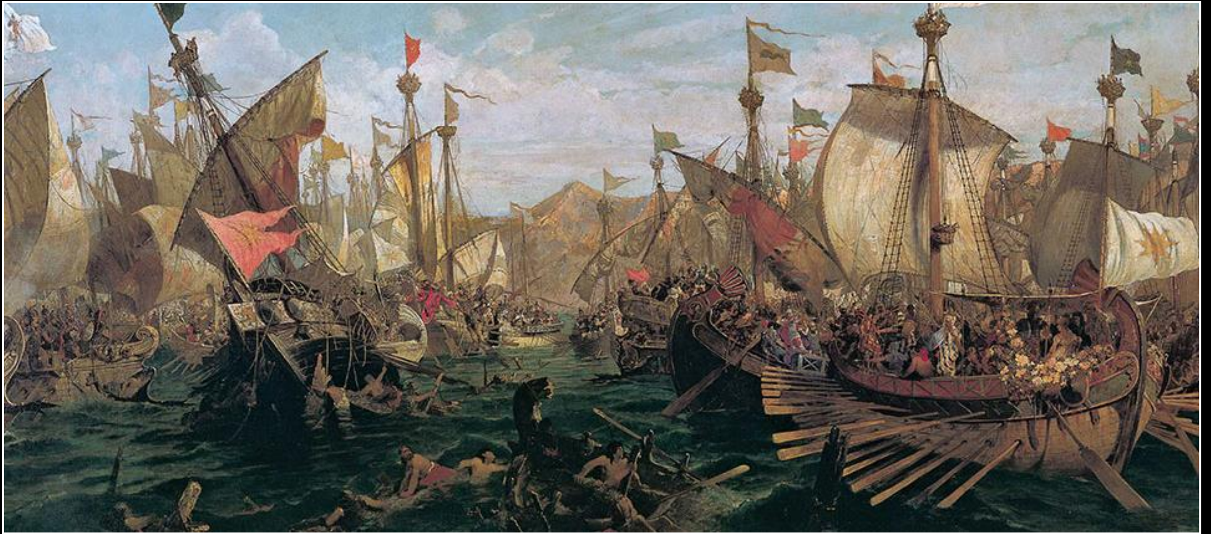
Κωνσταντίνος Βολανάκης, Η Ναυμαχία της Σαλαμίνας, 1882, λάδι σε καμβά, 150x200 εκ., Αρχείο Ναυτικού