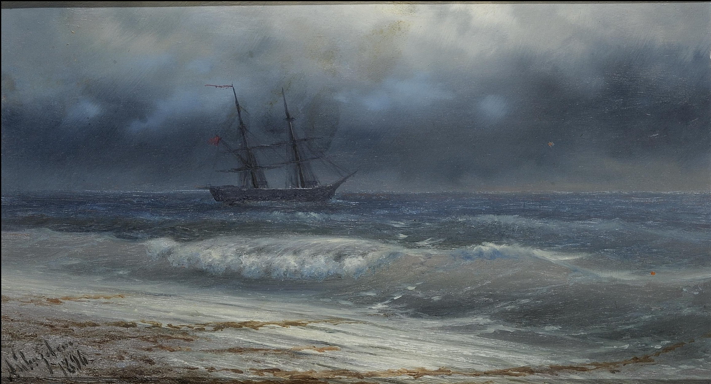
Ιβαν Αϊβάζονσκι, Πλοίο σε τρικυμία, λάδι σε καμβά, Συλλογή Ιδρύματος Αικατερίνης Λασκαρίδη