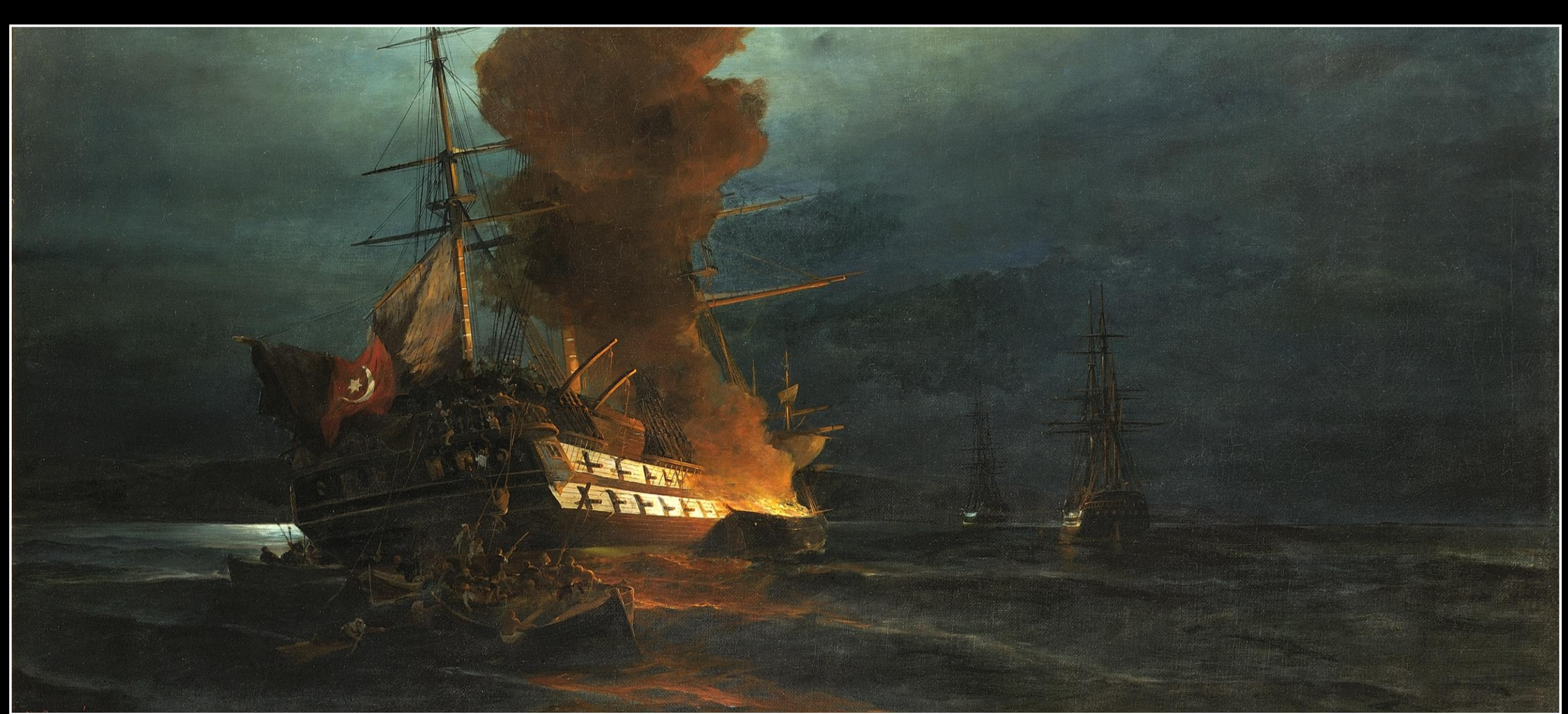
Κωνσταντίνος Βολανάκης, Η Πυρπόληση της Τουρκικής Ναυαρχίδας, λάδι σε καμβά, 79x114 εκ., Συλλογή Ιδρύματος Αικατερίνης Λασκαρίδη