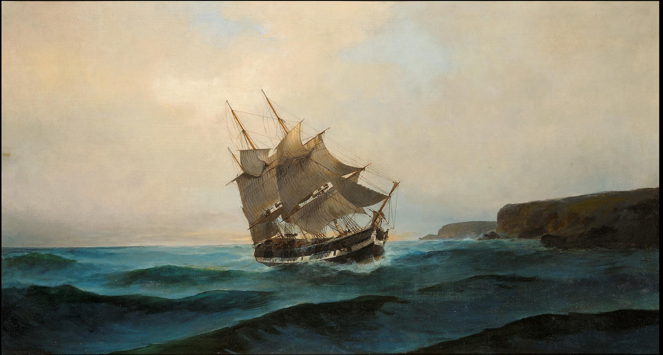
Κωνσταντίνος Βολανάκης, Φρεγάτα κοντά στην ακτή, 1899 – 1890, λάδι σε καμβά, 64x116 εκ., Συλλογή Ιδρύματος Αικατερίνης Λασκαρίδη