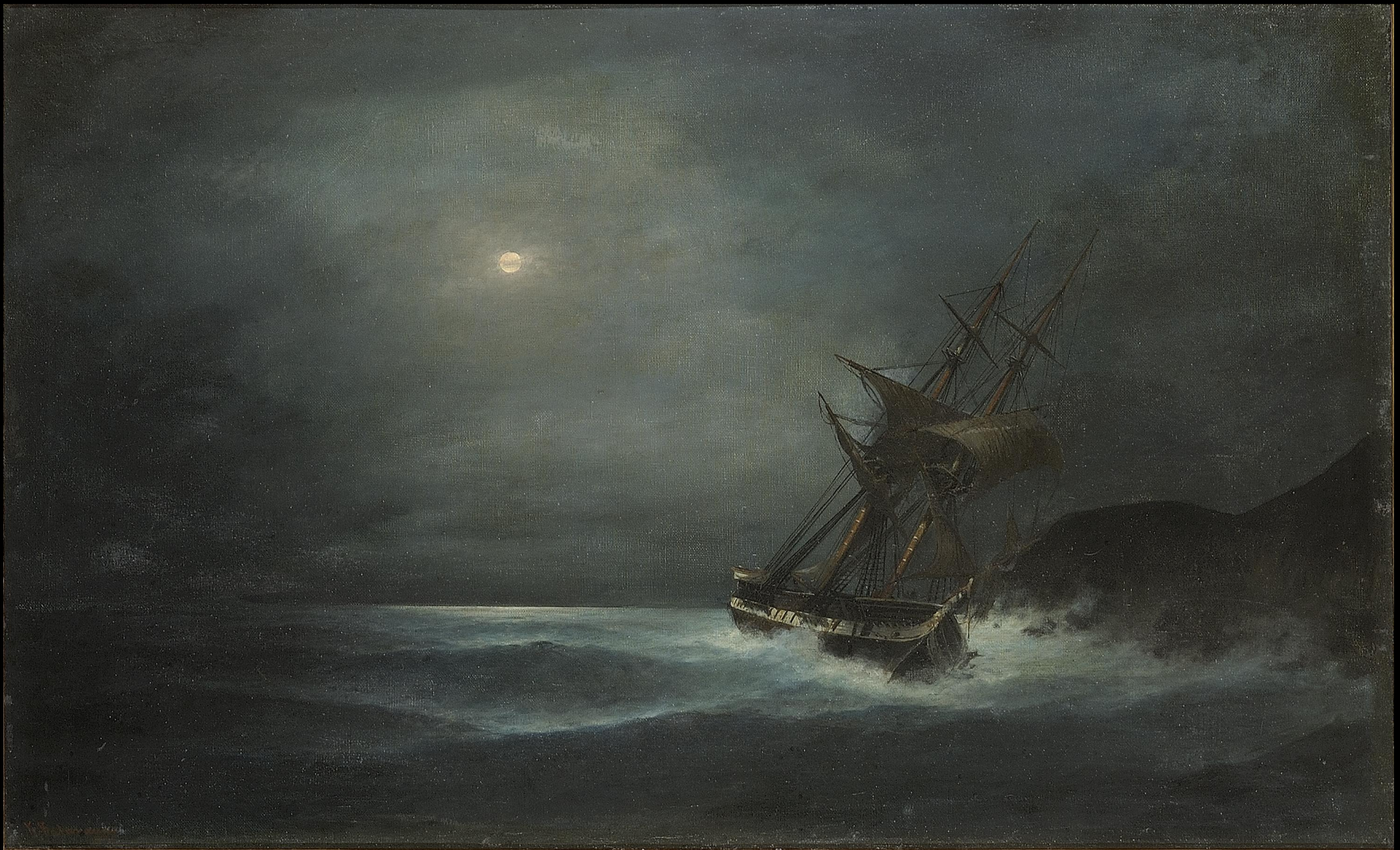
Κωνσταντίνος Βολανάκης, Φρεγάτα στο σεληνόφως, λάδι σε καμβά, 45x74.5 εκ., Συλλογή Ιδρύματος Αικατερίνης Λασκαρίδη