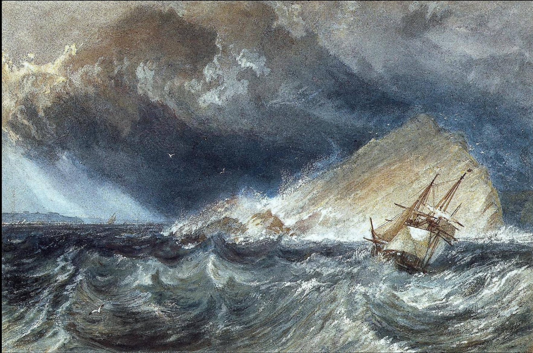
Joseph Mallord William Turner, Πλοίο απέναντι από το Mewstone, 1849, ακουαρέλα σε χαρτί, Εθνική Πινακοθήκη Ιρλανδίας