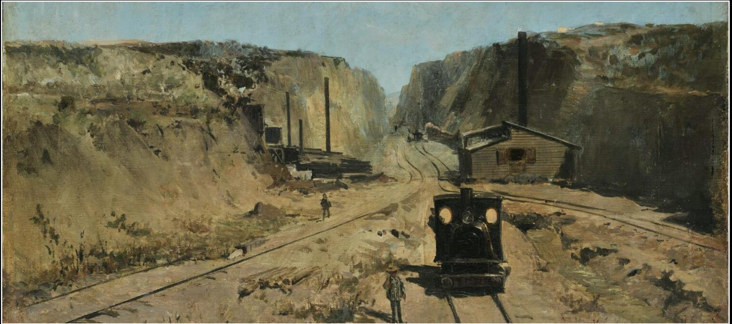
Κωνσταντίνος Βολανάκης, Η Διάνοιξη της Διώρυγας της Κορίνθου, λάδι σε καμβά, 34x47 εκ., Συλλογή της Τράπεζας της Ελλάδος, Αθήνα