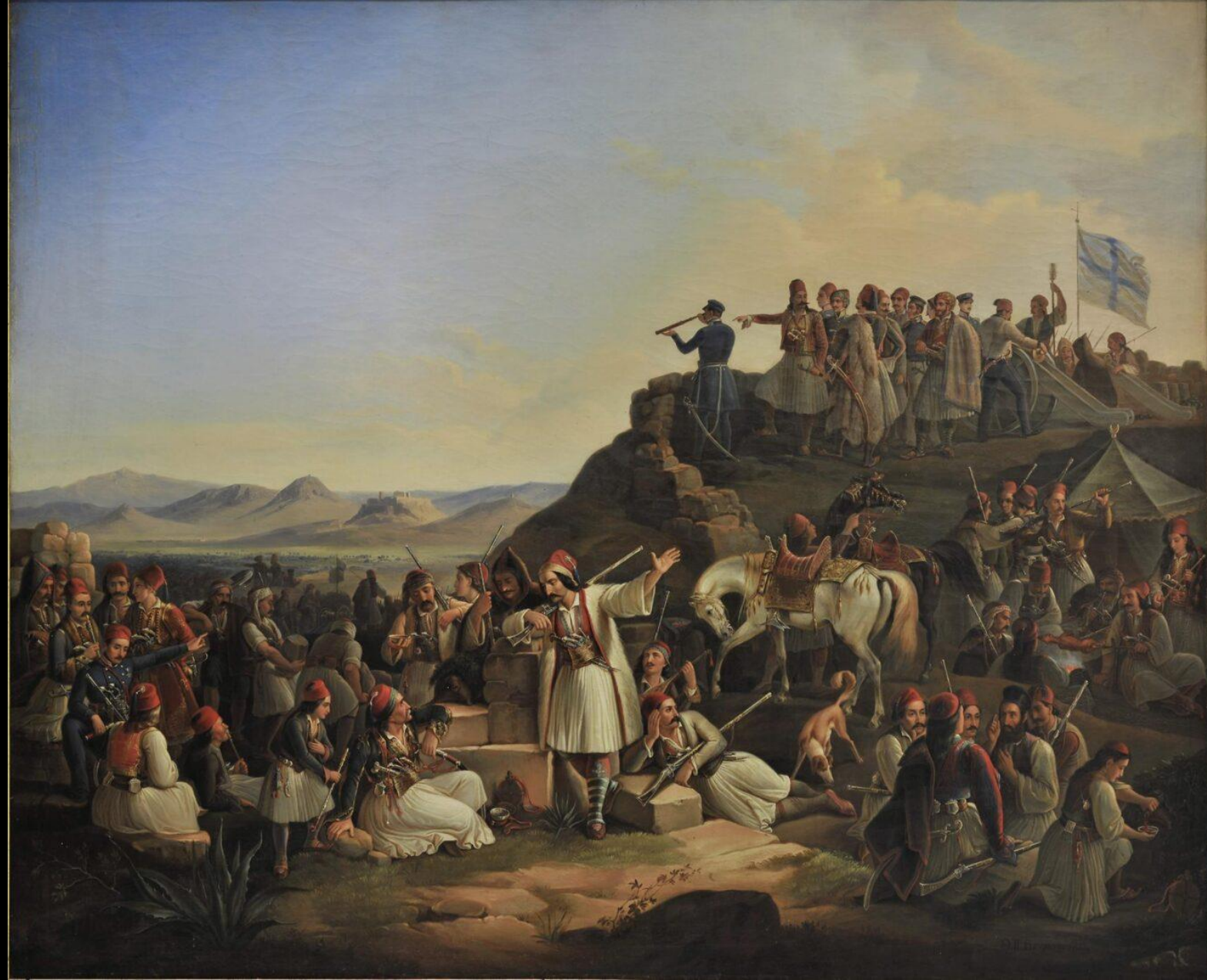
Θεόδωρος Βρυζάκης, Το στρατόπεδο του Καραϊσκάκη στο Φάληρο, 1855, λάδι σε καμβά, 145x178 εκ., Εθνική Πινακοθήκη, Αθήνα