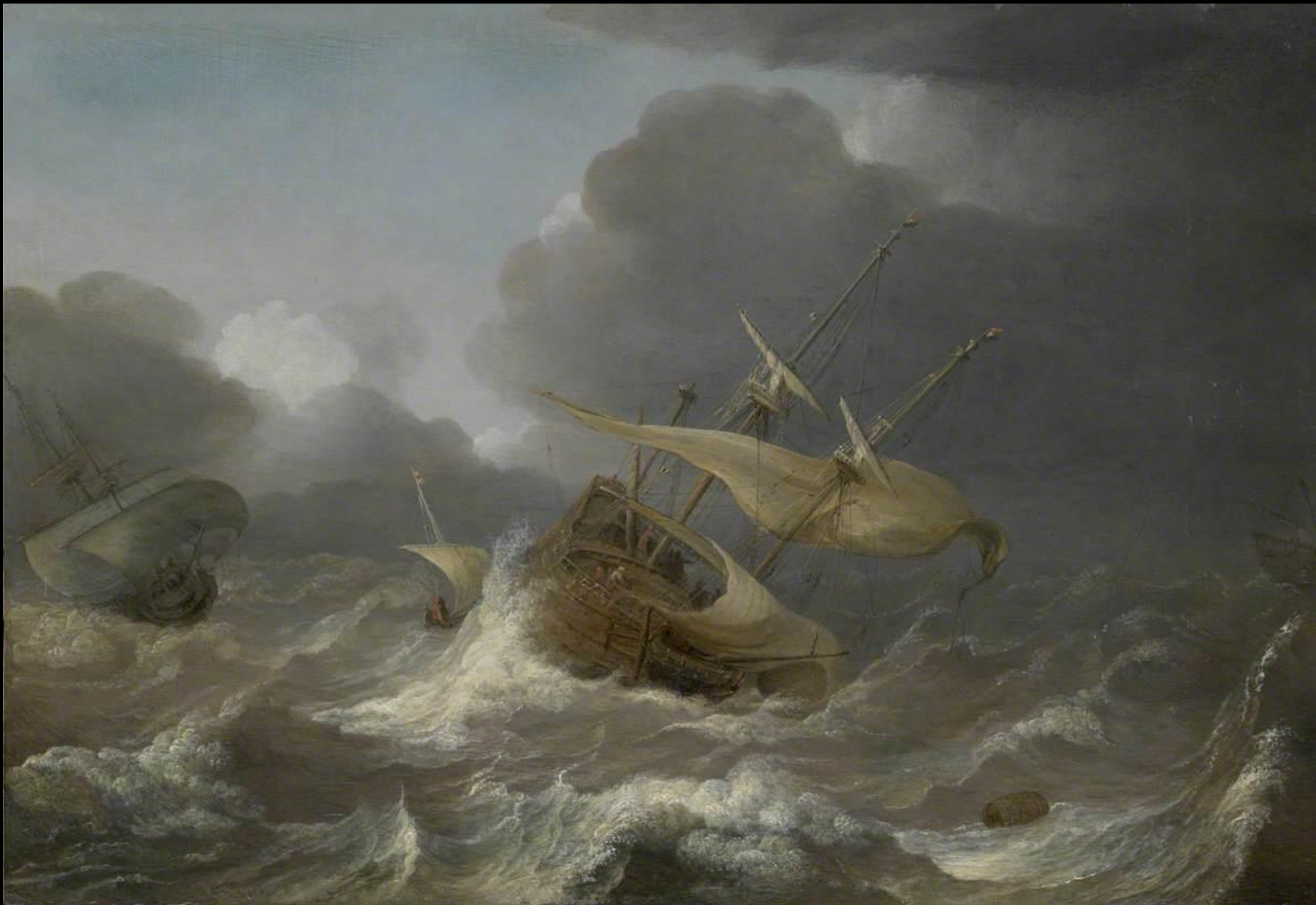
Jan Porcellis, Ολλανδικά πλοία σε φουρτούνα, 1620, λάδι σε καμβά, 267x356 εκ., National Maritime Museum Greenwich, Λονδίνο